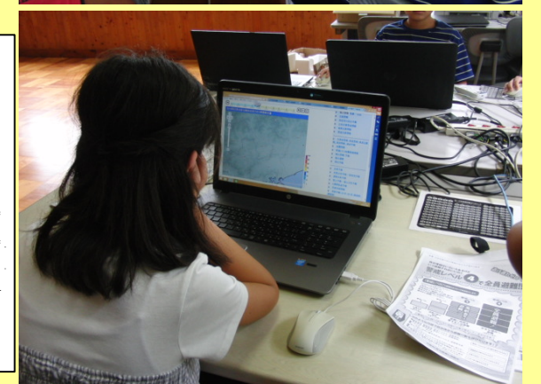
授業を受けての感想