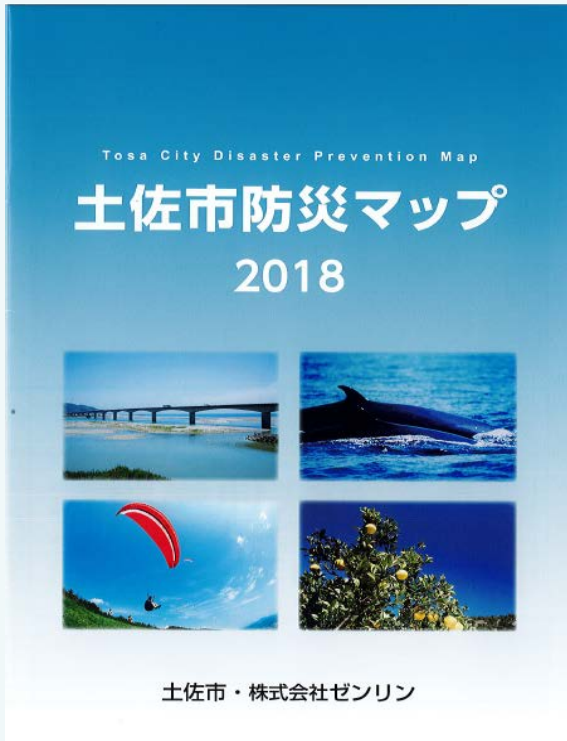
土佐市防災マップ(抜粋)