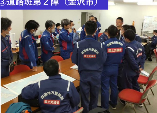
③道路班第2陣（金沢市）