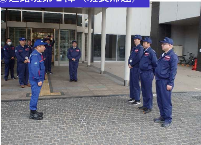
①道路班第1陣（班長帰還）