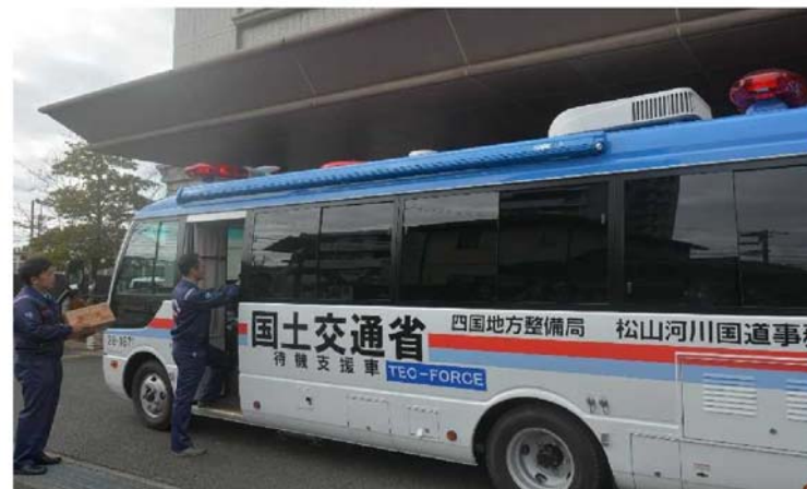
▲松山河川国道事務所での待機支援車の出発式