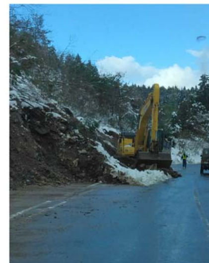
▲珠洲市の現地状況