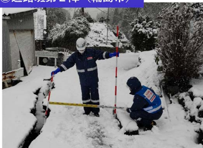
②道路班第2陣（輪島市）