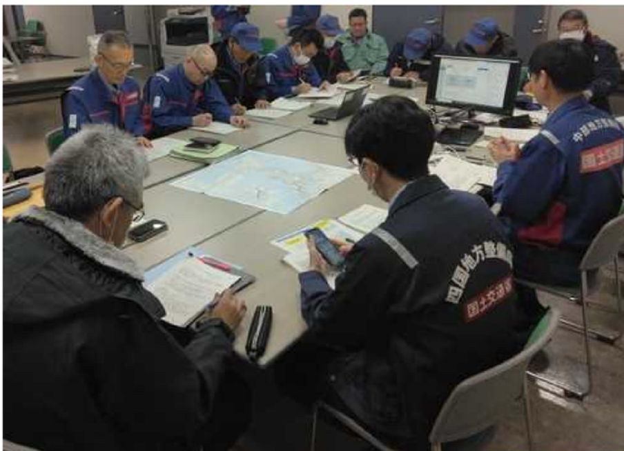
▲金沢河川国道事務所での打ち合わせ状況

○本日現地入りし、珠洲市役所及び金沢河川国道事務所にて、明日以降の調査について打合せを行いました。