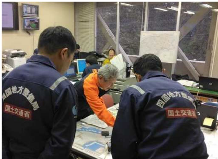
▲珠洲市 泉谷市長と調査方針を確認