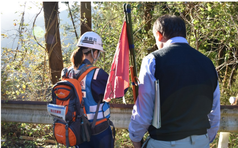
【埼玉県比企郡ときがわ町:被災状況調査】