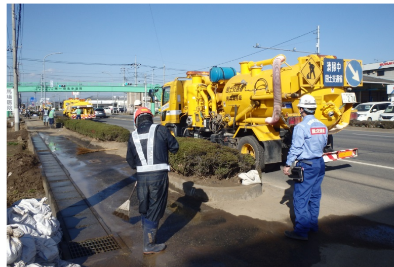
【栃木県佐野市:側溝清掃】