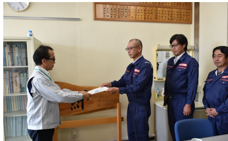
【相双建設事務所:事務所長に被災状況調査を報告】