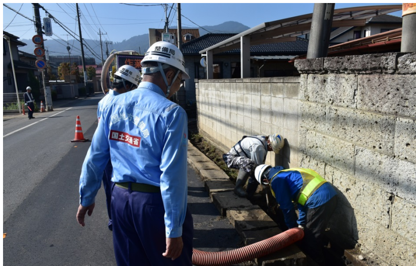
【栃木県栃木市:側溝清掃】