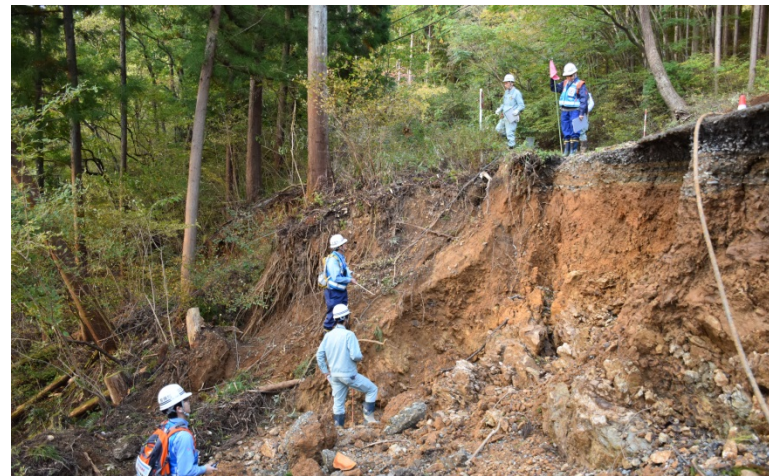
【埼玉県比企郡ときがわ町:被災状況調査】