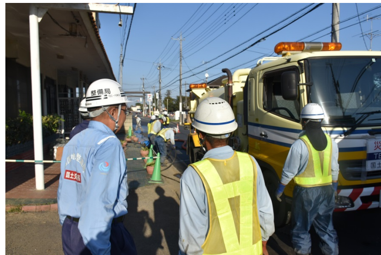
【栃木県栃木市:側溝清掃】