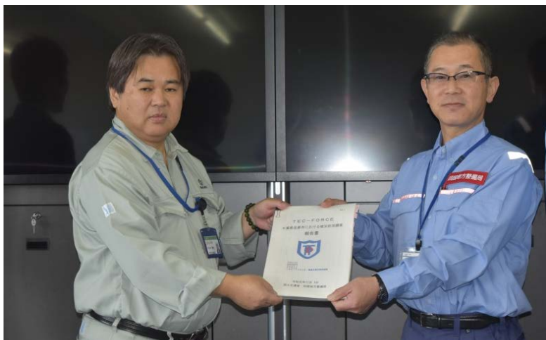
【佐倉市役所:土木部理事に被災状況調査を報告】