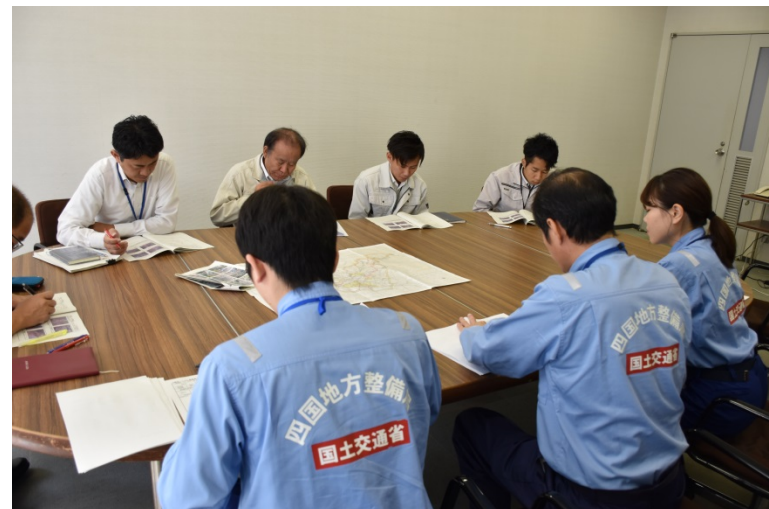
【本庄市役所:被災状況調査を報告】