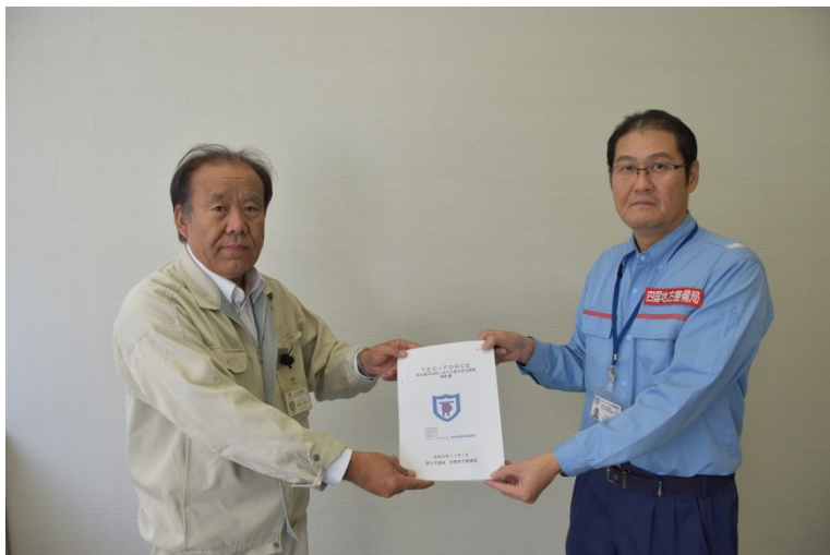
【本庄市役所:道路整備課長に被災状況調査を報告】