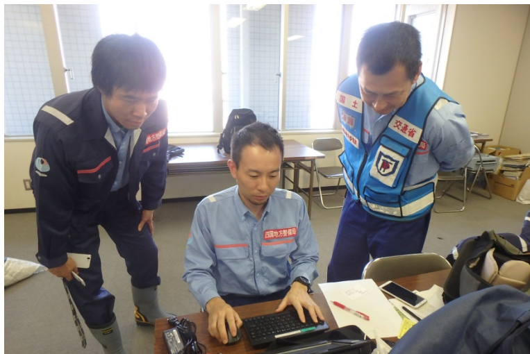
【千葉県茂原市:打ち合わせ】