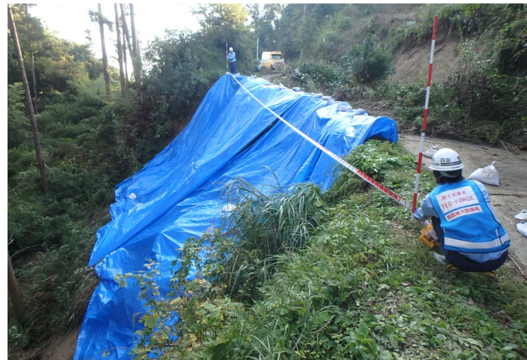
【千葉県茂原市:被災状況調査】