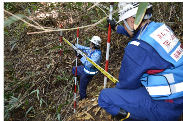
【福島県双葉郡川内村:被災状況調査】