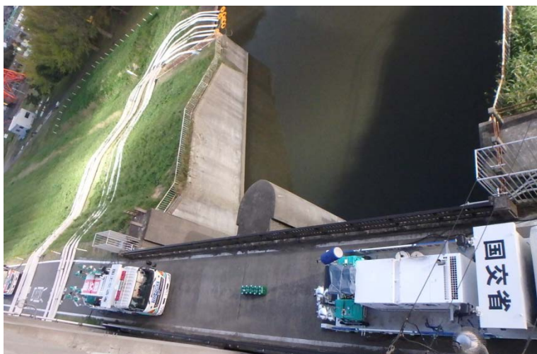
【印旛水門:排水作業】