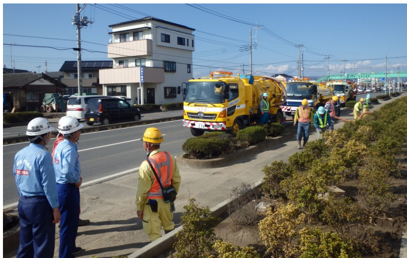
【栃木県佐野市:側溝清掃】