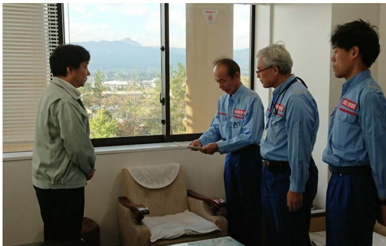
【県西土木事務所:被災状況調査報告】