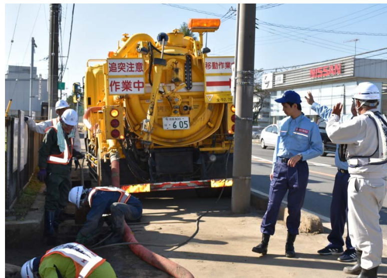
【栃木県佐野市:側溝清掃】