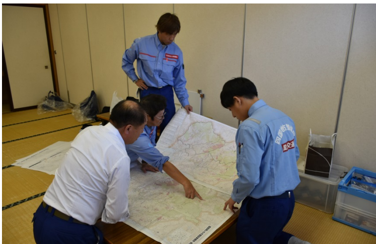
【福島県いわき市:打ち合わせ】

○福島県いわき市・相馬郡飯舘村・双葉郡川内村において、被災状況を調査しました。(土砂災害班)