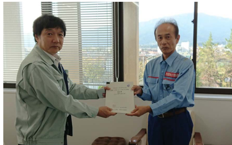
【県西土木事務所:被災状況調査報告】