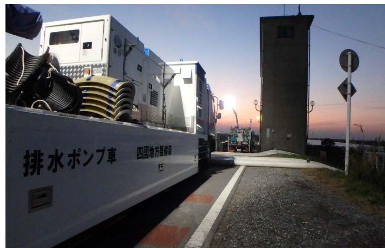
【印旛水門:排水作業】