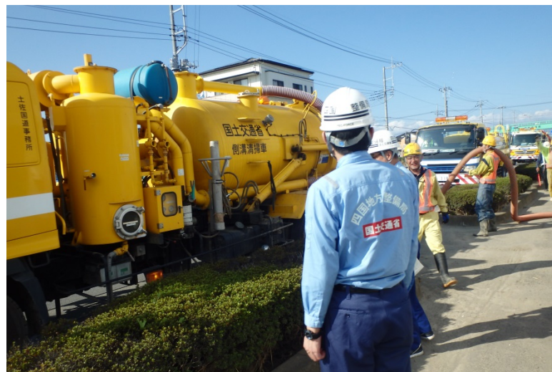
【栃木県佐野市:側溝清掃】