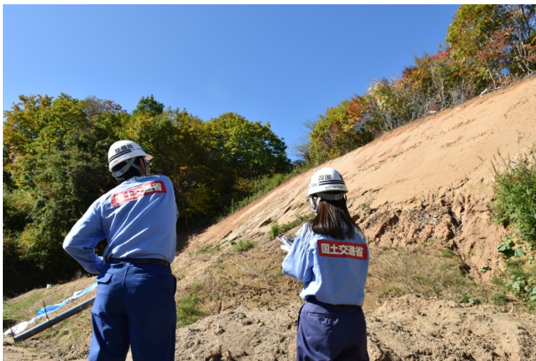
【福島県相馬郡飯舘村:被災状況調査】