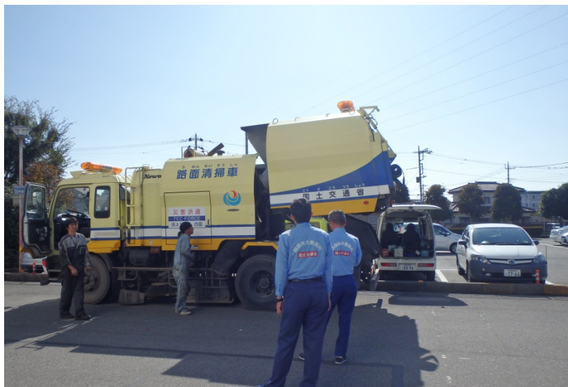
【栃木県安足土木事務所:車両確認】