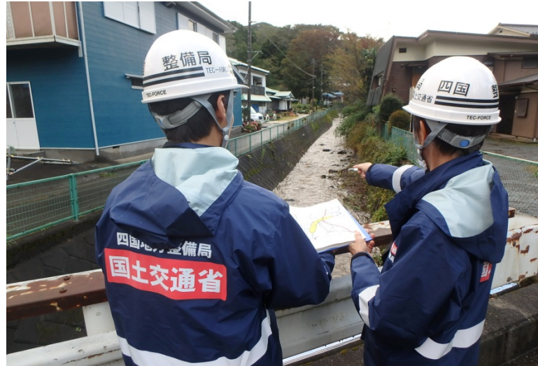
【神奈川県足柄上郡松田町：被災状況調査】