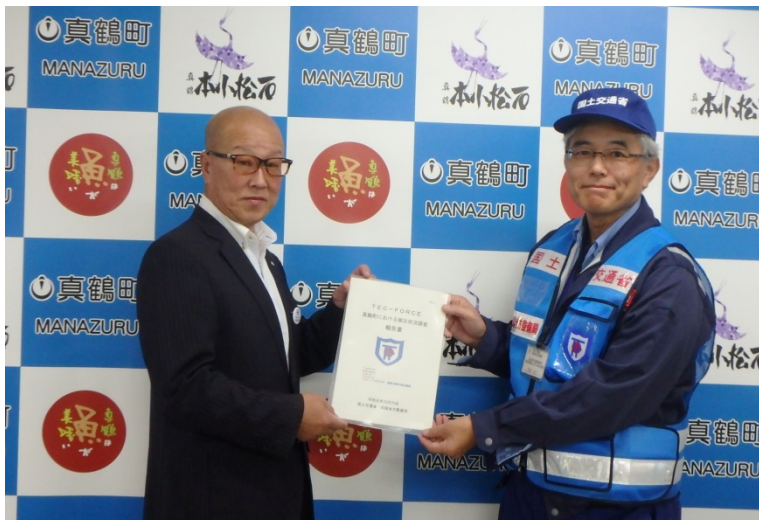
【神奈川県足柄下郡真鶴町：被災状況調査報告】