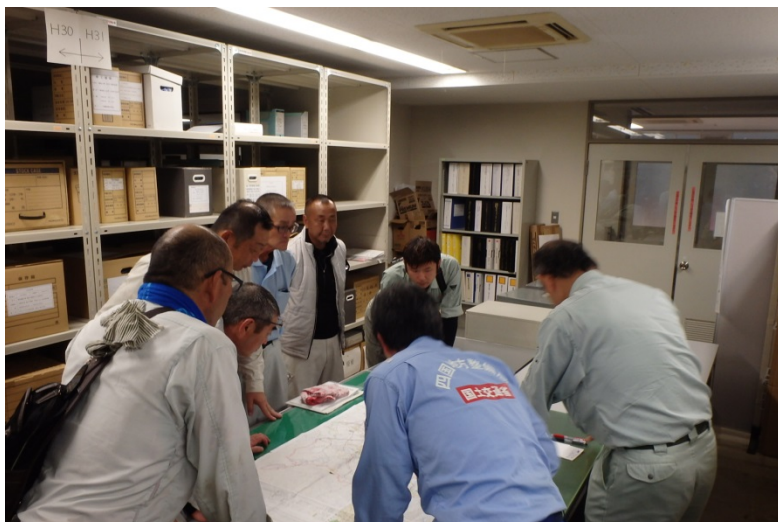
【栃木県足利市:打ち合わせ】

○栃木県安足土木事務所管内において、路面清掃・側溝清掃を実施しました。(応急対策班)