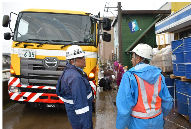
【栃木県佐野市:側溝清掃】