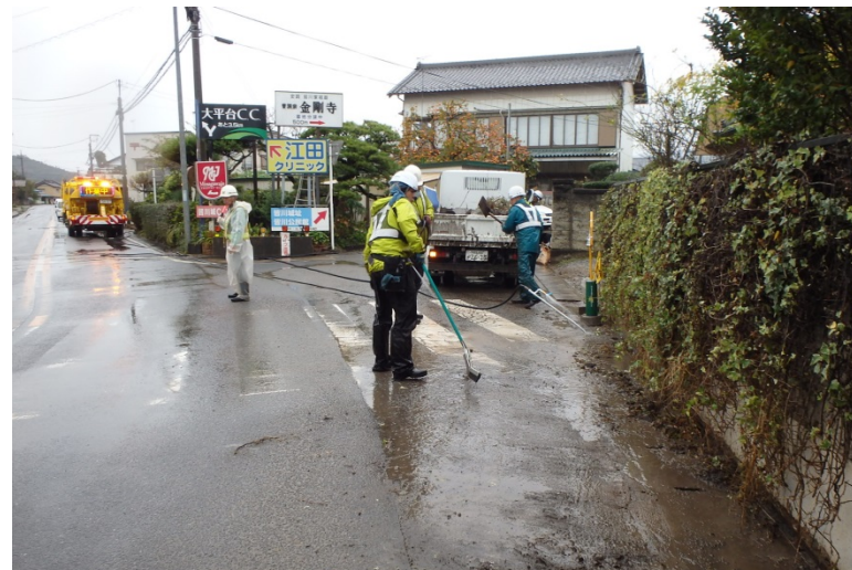
【栃木県栃木市:路面清掃】