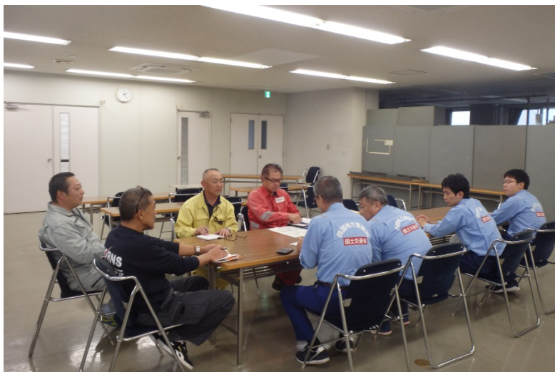
【栃木県足利市:打ち合わせ】