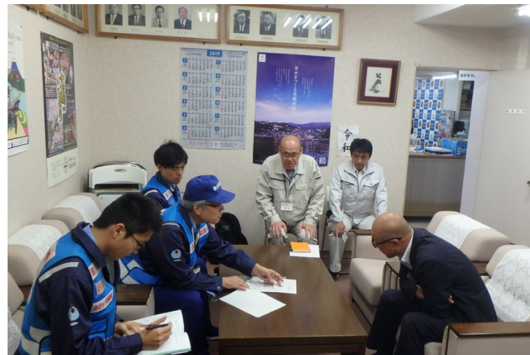
【神奈川県足柄下郡真鶴町：被災状況調査報告】