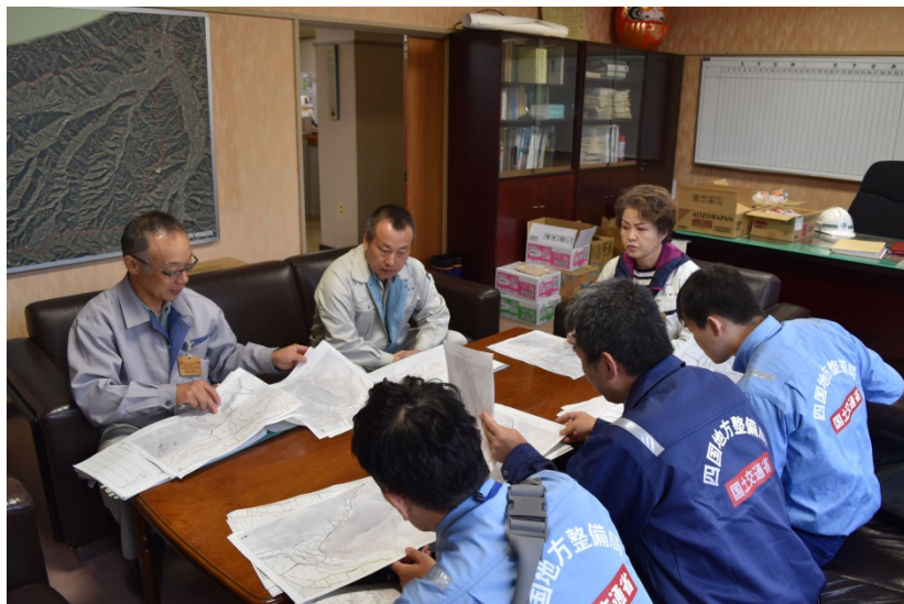
【長野県上田市: 地元自治体打合せ状況】

○長野県上田市、佐久郡佐久穂町において土砂災害の被災状況の調査を実施しました。(河川班)