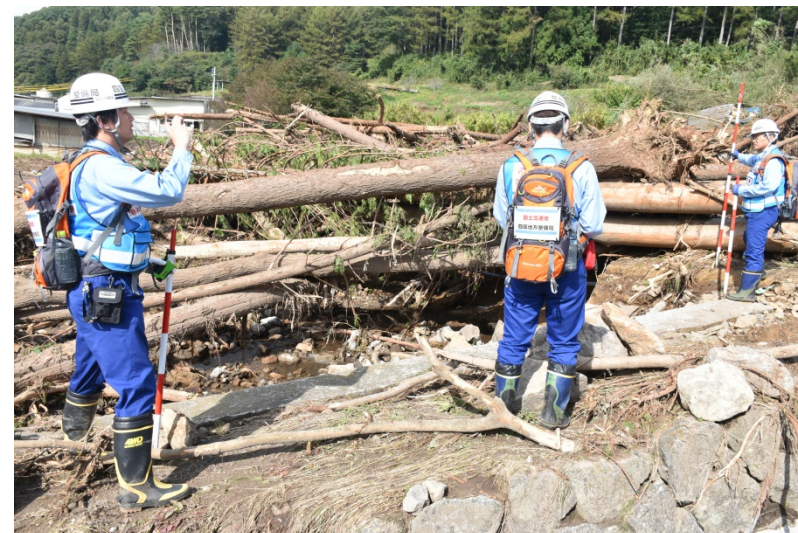
【長野県佐久郡佐久穂町: 被災状況調査状況】