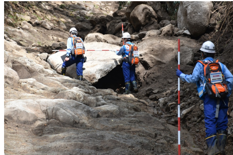
【長野県佐久郡佐久穂町: 被災状況調査状況】