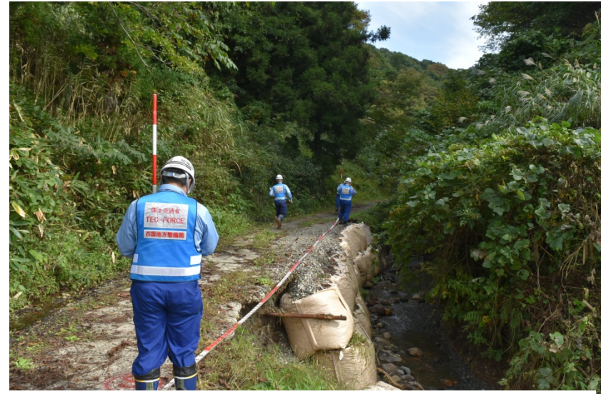
【新潟県妙高市:被災状況調査】