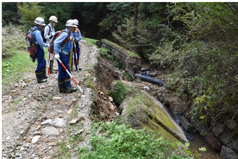
【長野県上田市: 被災状況調査状況】