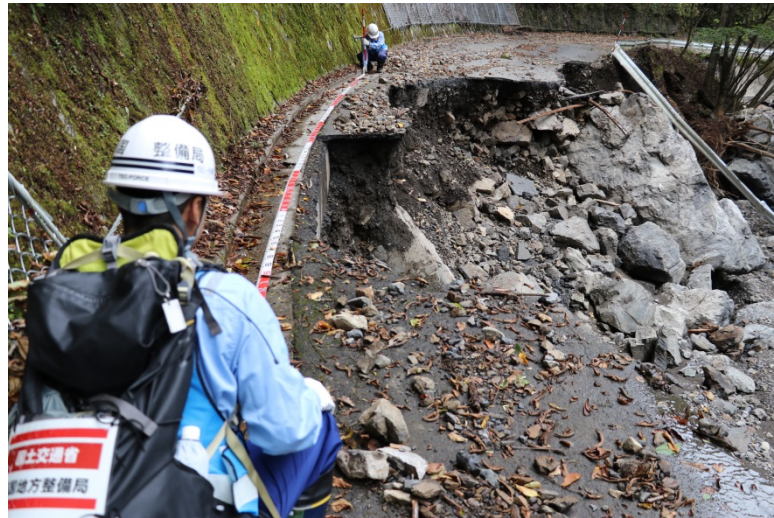
【群馬県多野郡上野村:被災状況調査】