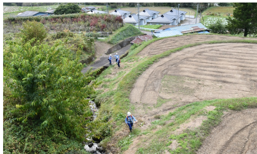
【長野県南佐久郡南相木村：被災状況調査報告状況】