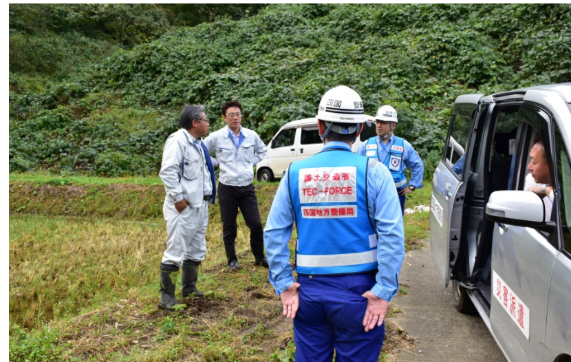
【新潟県妙高市:被災状況調査】