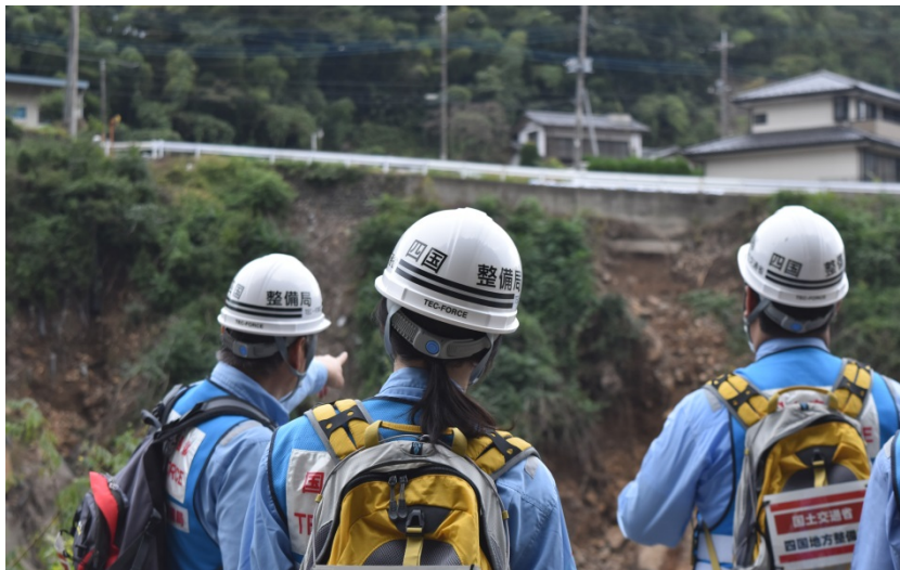
【群馬県甘楽郡下仁田町:被災状況調査】