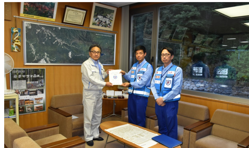
【長野県南佐久郡南相木村：被災状況調査報告】