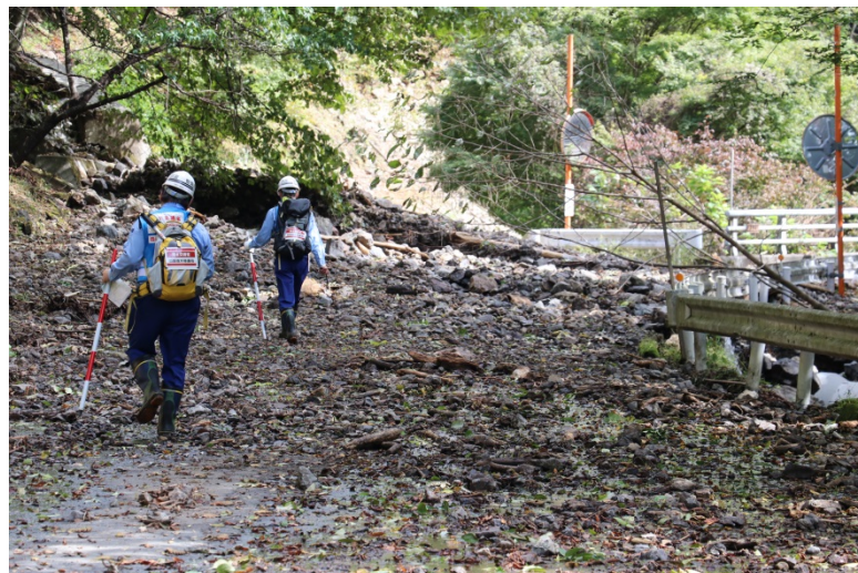
【群馬県多野郡上野村:被災状況調査】