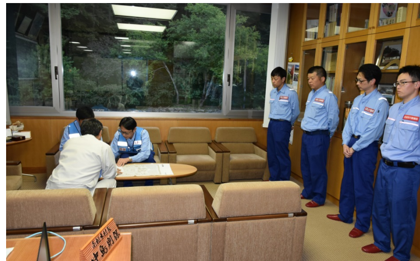
【長野県南佐久郡南相木村：被災状況調査報告】