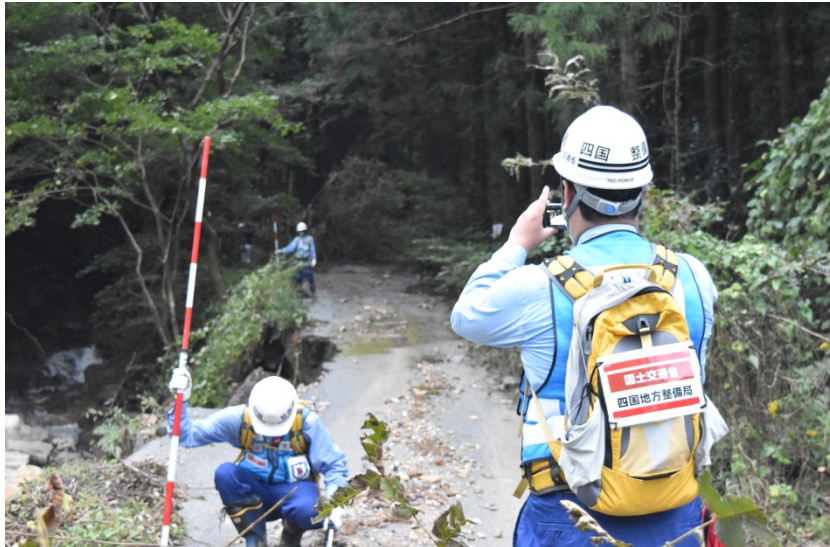
【群馬県甘楽郡下仁田町:被災状況調査】

○群馬県甘楽郡下仁田町、新潟県妙高市において道路の被災状況の調査を実施しました。(道路班)