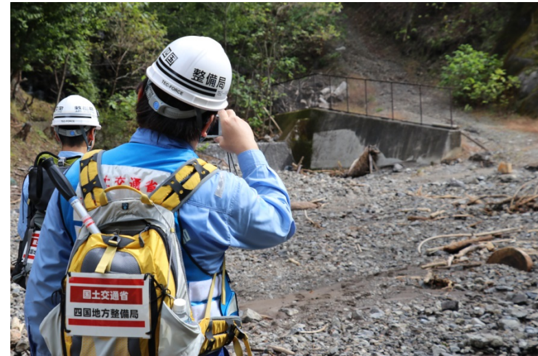
【群馬県多野郡上野村:被災状況調査】