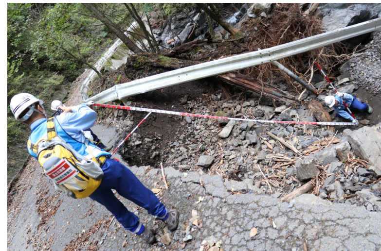
【群馬県多野郡上野村:被災状況調査】