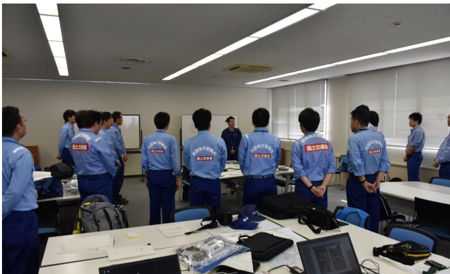
【鹿児島県土木部次長挨拶】