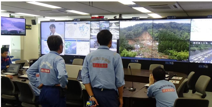
【ドローンの映像を確認】