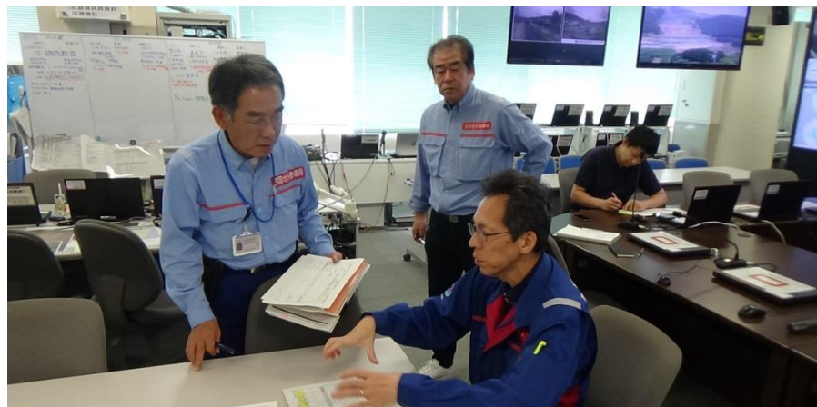
【災害対策本部での打合せ状況】