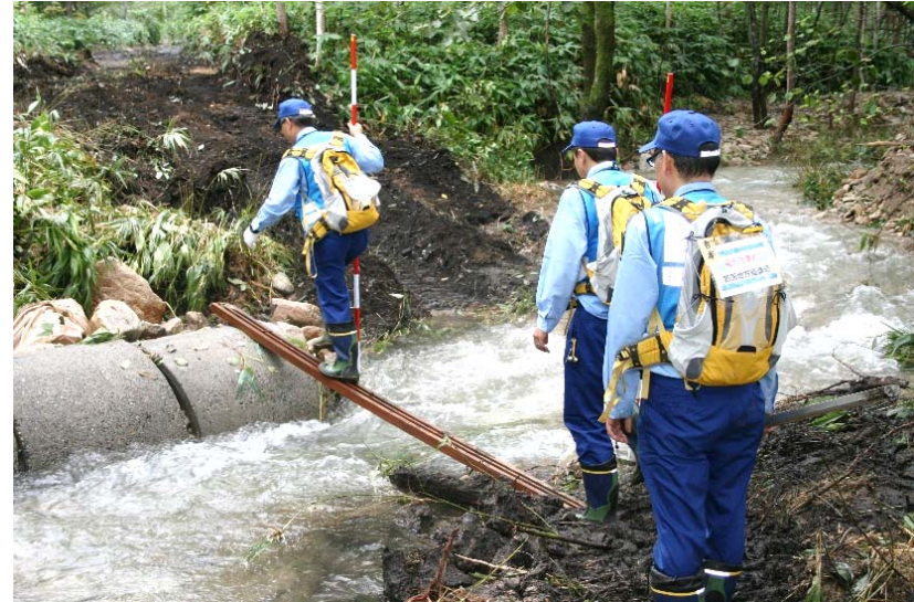
久山川上流の被災状況調査