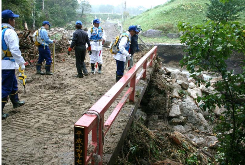
久山川上流の道路被災状況調査