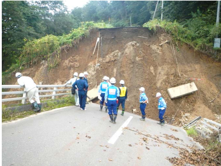
落橋状況を確認する隊員(明星橋:帯広市)