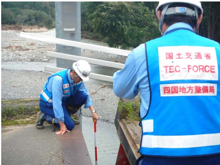
沓座点検をする隊員(明星橋:帯広市)