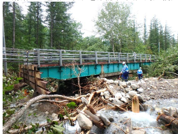
橋梁の被災状況調査(千鳥大橋:帯広市)