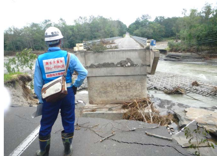
滑落した道路の状況を確認する(戸蔦大橋)