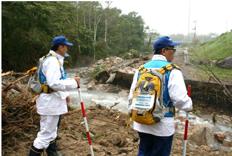
久山川上流の道路被災状況調査