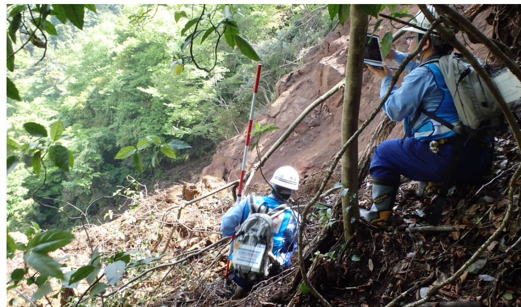
河道閉塞調査を行うTEC-FORCE隊員