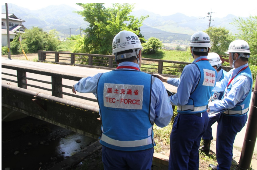
橋梁を点検中の隊員(南阿蘇村)