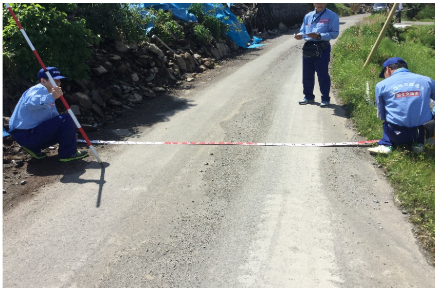
生活道路現況確認調査

○ TEC-FORCE(司令部、道路班)の活動状況 (H28. 5. 4) ◇場所：西原村