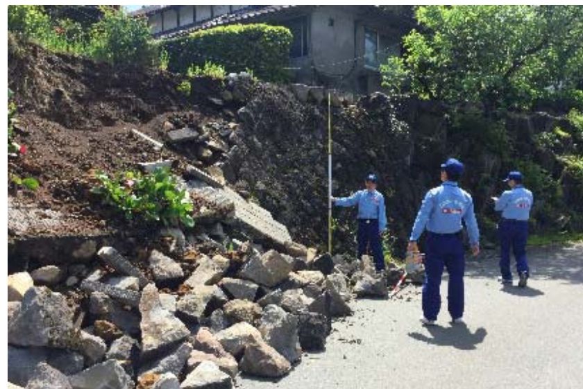
生活道路被災状況等調査