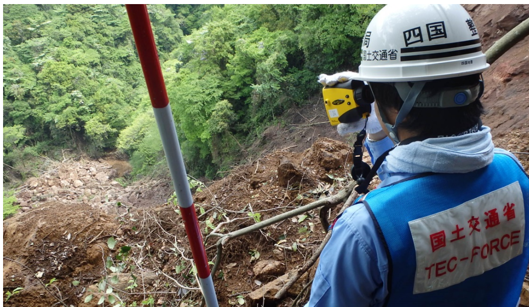
河道閉塞調査を行うTEC-FORCE隊員