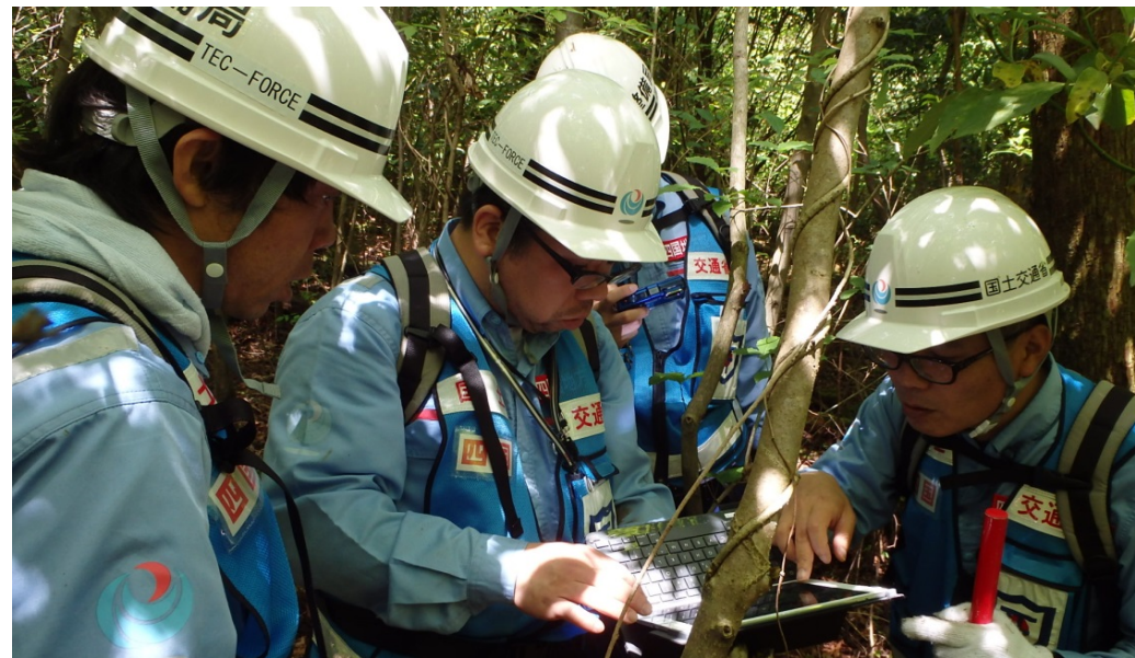
険しい山林の中でナメリ川左岸の調査箇所の確認