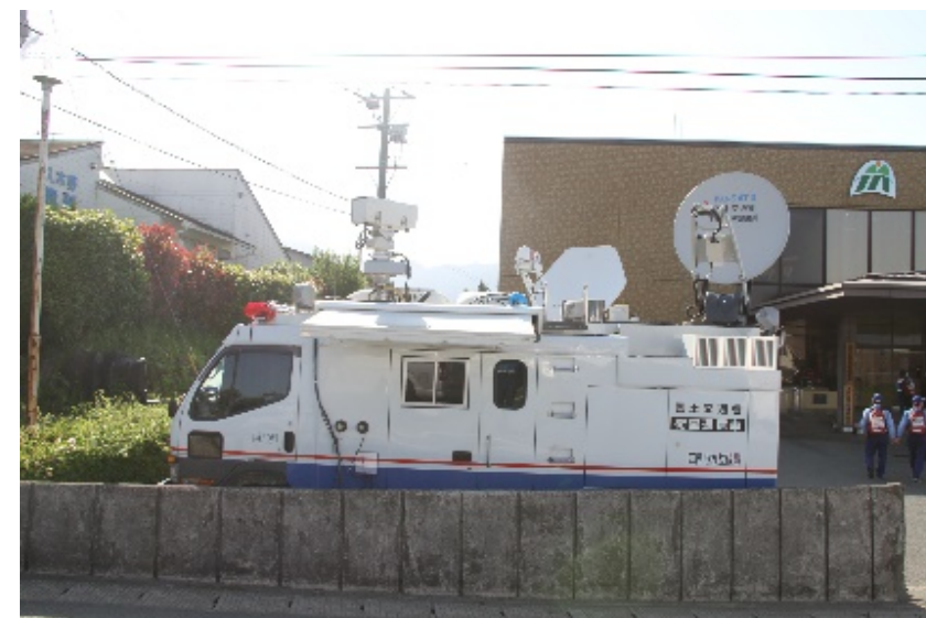
松山河川国道事務所から派遣された衛星通信車(南阿蘇村)