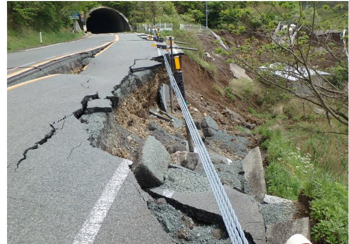
俵山トンネル西原村側の道路損壊状況