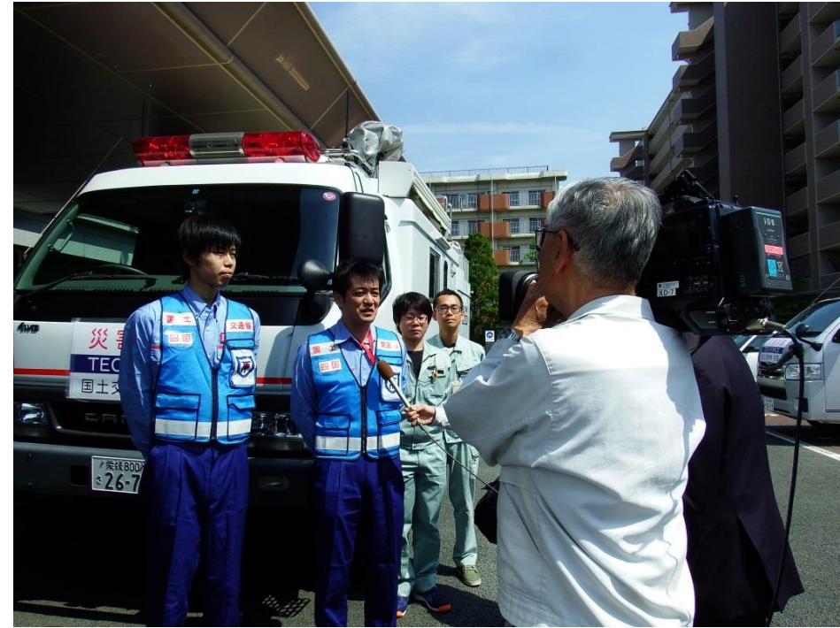
5月2日 衛星通信車出発式（松山河川国道事務所）