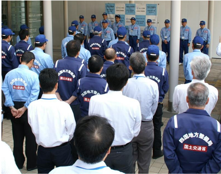
5月2日 司令部・道路班出発式（本局）

四国地方整備局から、平成28年熊本地震による被災状況の把握や被害の拡大防止などを図り迅速な復旧を支援するため、TEC-FORCEとして派遣され活動している司令部等の交代隊員12名が本日出発しました。（5月2日）