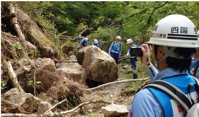
崩落箇所を測定するTEC-FORCE隊員