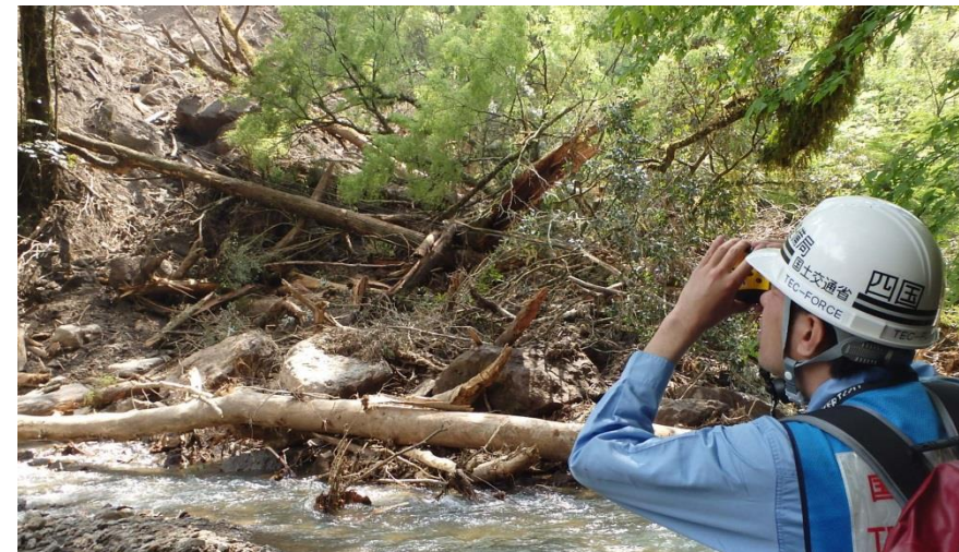
崩落箇所を測定するTEC-FORCE隊員