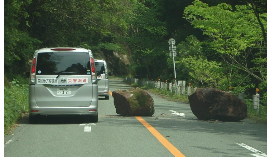
現場（菊池溪谷）に向かう砂防班の車両