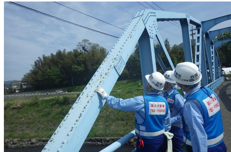
南阿蘇村の橋梁を点検中の隊員(道路2班)