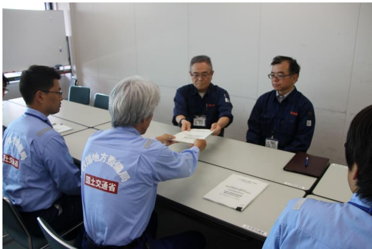
熊本県に県道28号の調査結果を報告(道路1班)