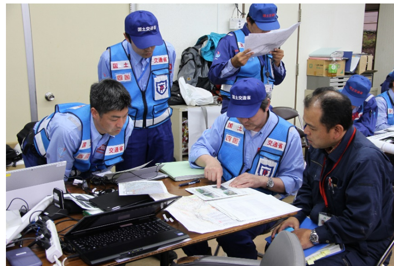
南阿蘇村建設課長への報告