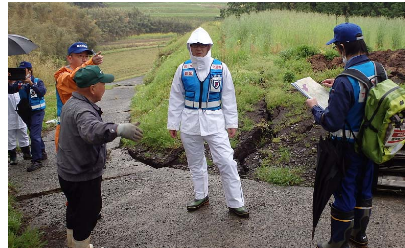
土地の所有者の方から被害状況を確認