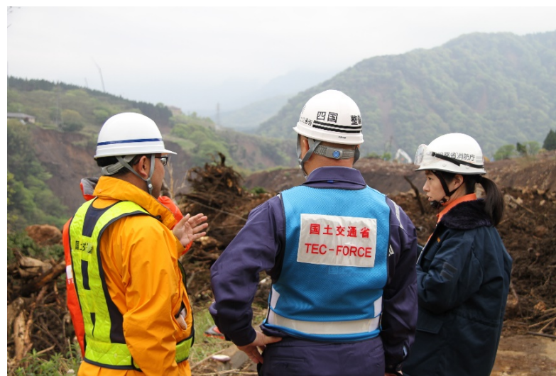
消防庁との情報共有(行方不明者捜索支援)