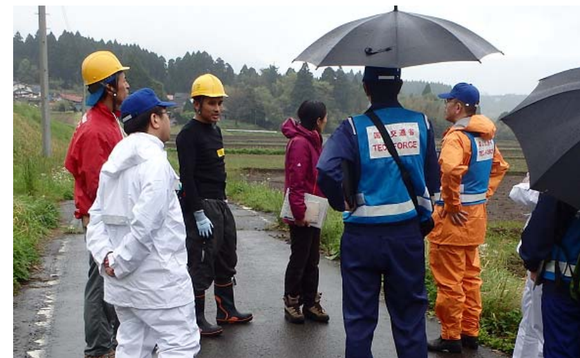
ボランティアで活動している方から危険箇所の相談を受ける隊員