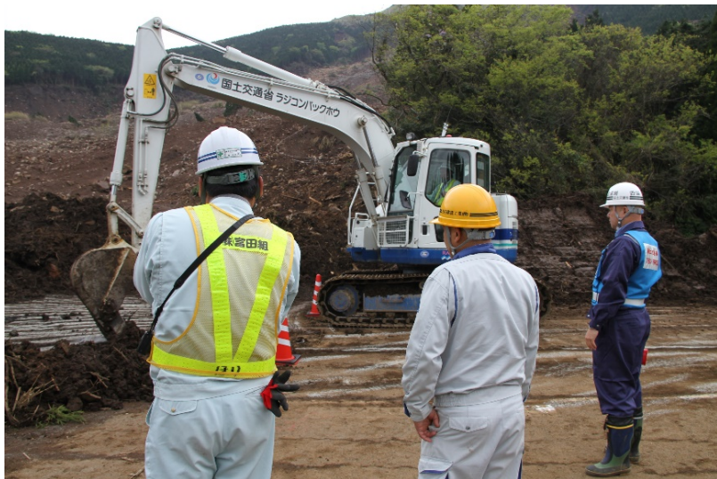
建設業者と協力し土砂撤去作業(大規模崩落箇所)

○ TEC-FORCE(司令部、道路班)の活動状況 (H28. 4. 25) ◇場所:南阿蘇村