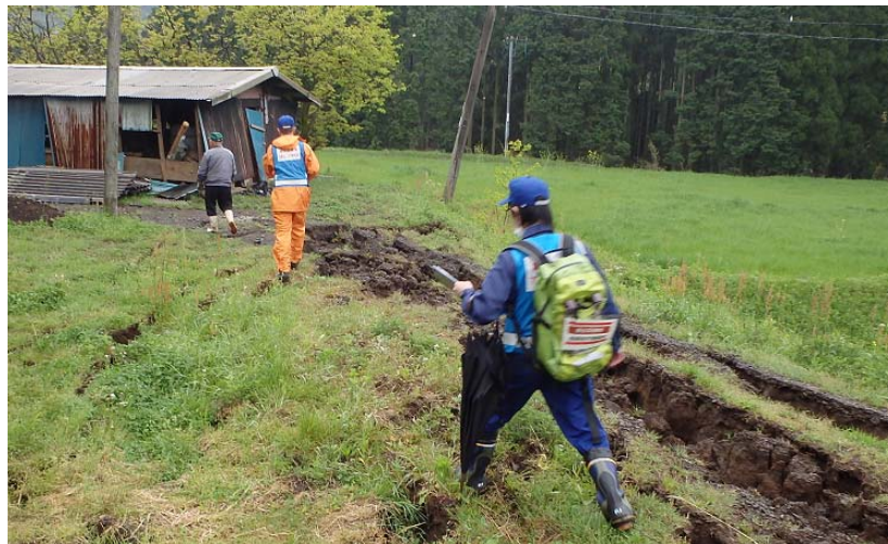
被害状況を調査中の隊員