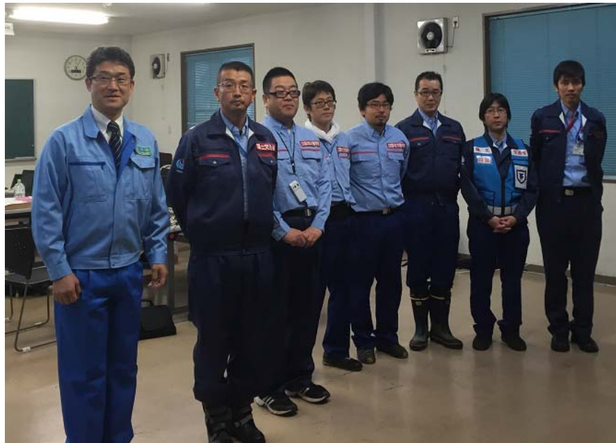
河野宮崎県知事が隊員を激励(宮崎県西臼杵支庁)