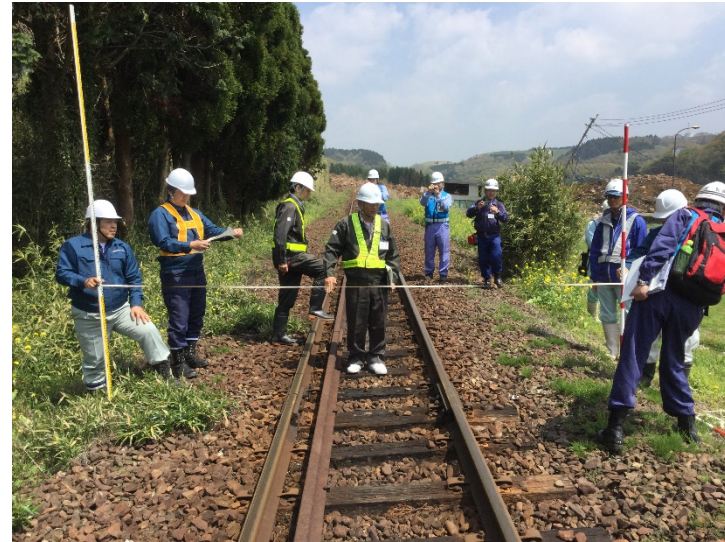
予定用地の調査状況