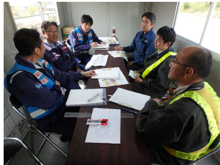
設計条件に関する打合せ状況