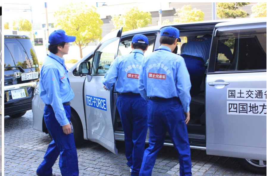
4月20日出発式の様子