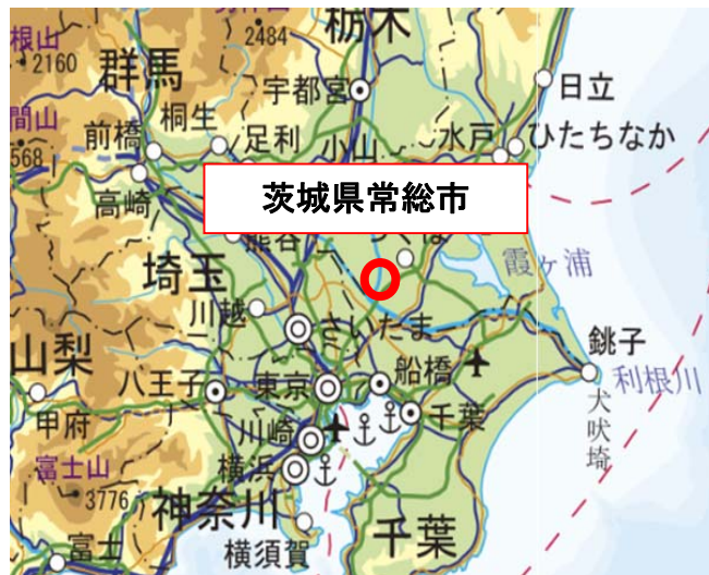
国土地理院 地理院地図使用