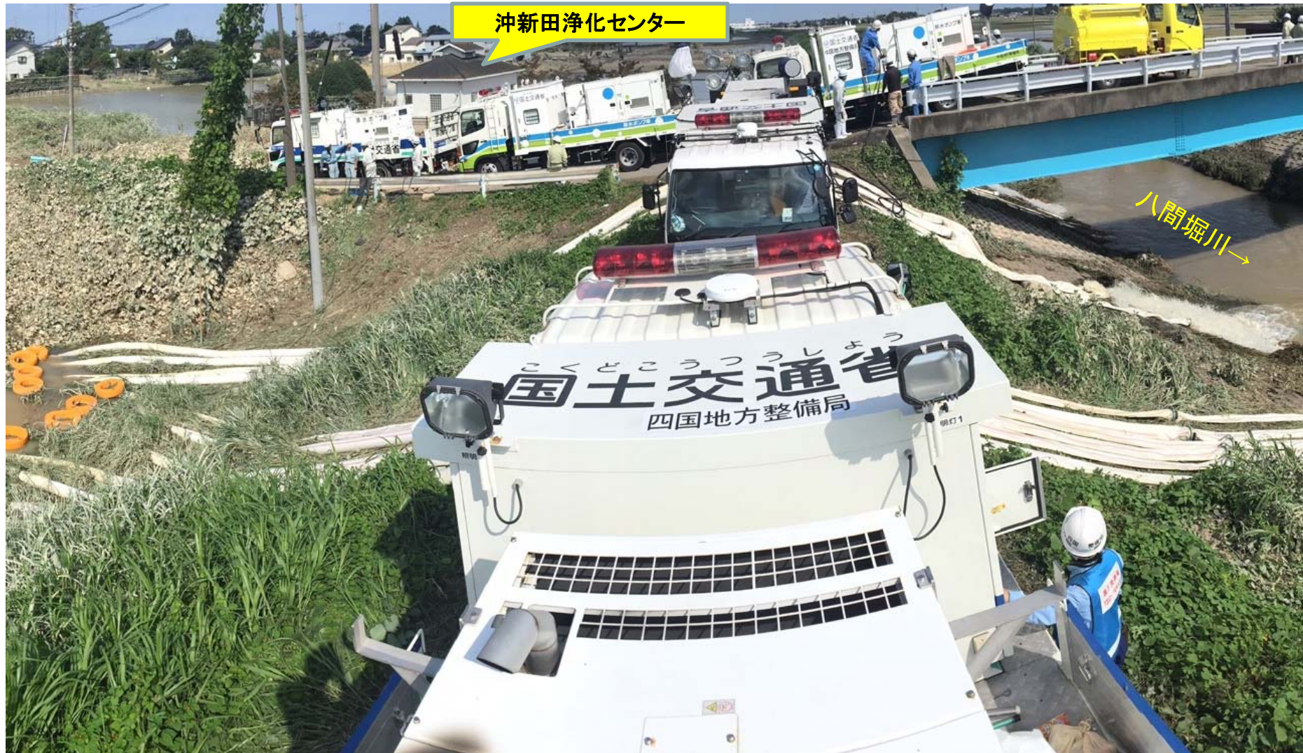
常総市上大橋周辺における大詰めの排水作業