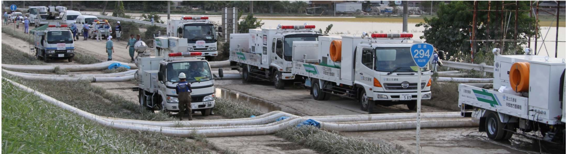
各整備局の排水ポンプ車による作業（四国地整、九州地整、中部地整）