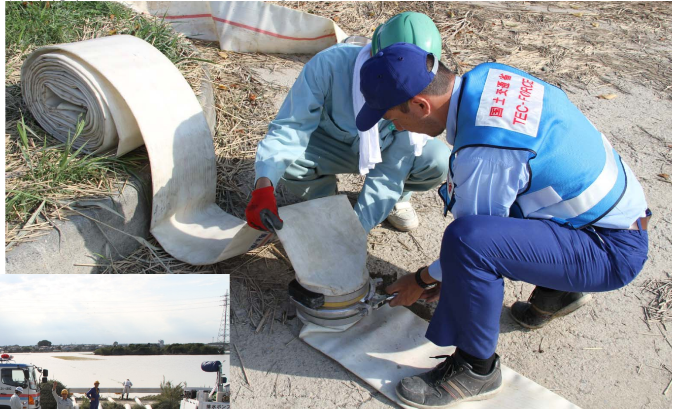
排水ポンプ車のホースのジョイント作業を指導するTEC-FORCE隊員