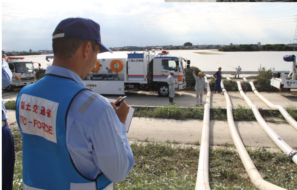
排水ポンプ設置のリードタイムを記録