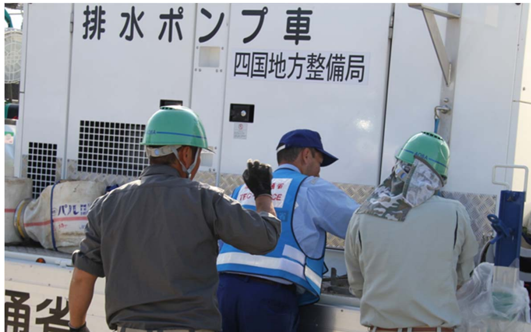
排水ポンプ車及び照明車の装備を確認する TEC-FORCE隊員