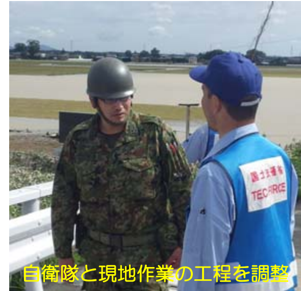
自衛隊と現地作業の工程を調整