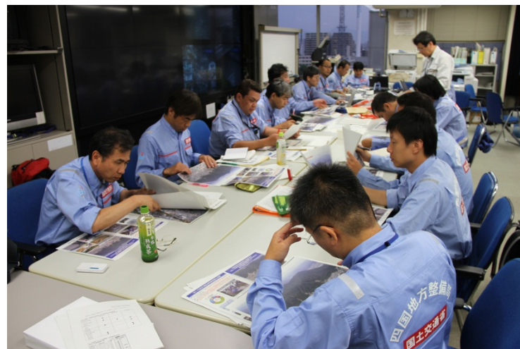
土砂撤去状況等を資料で確認 (中国地整)