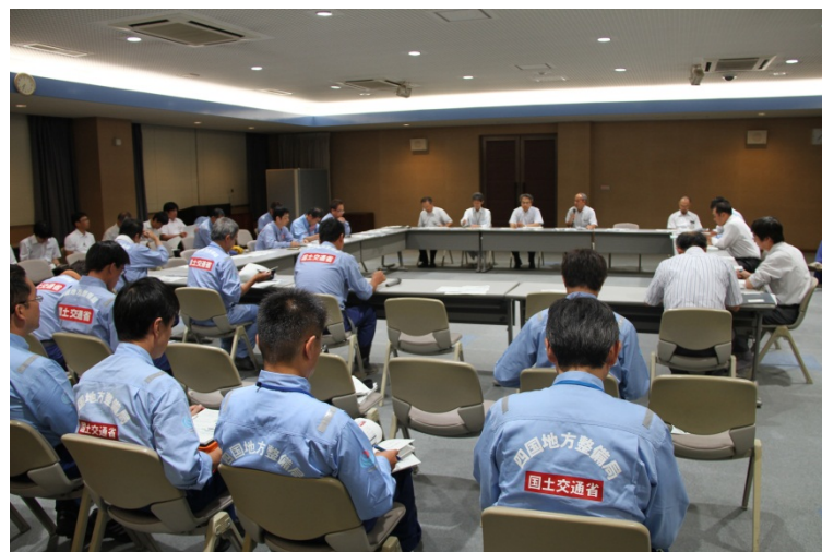
全体報告会会議 (広島国道事務所)