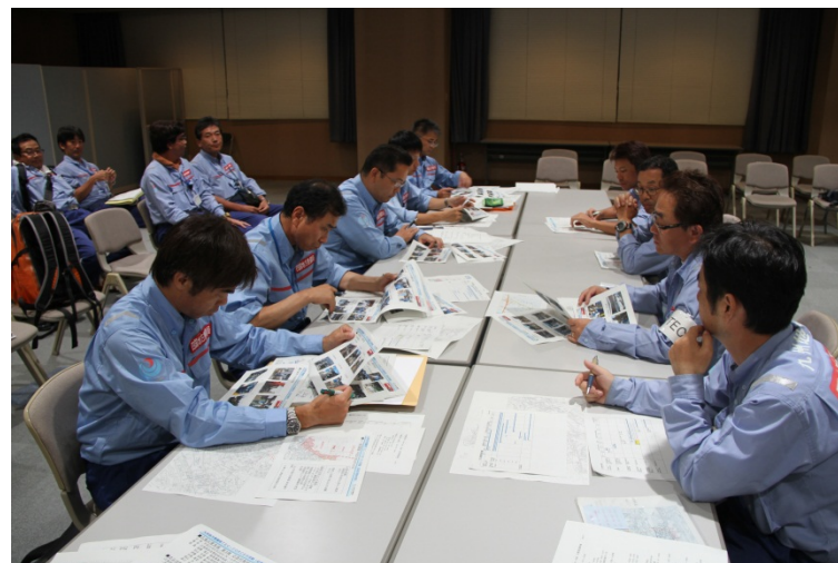
九州地整からの引き継ぎ (広島国道事務所)