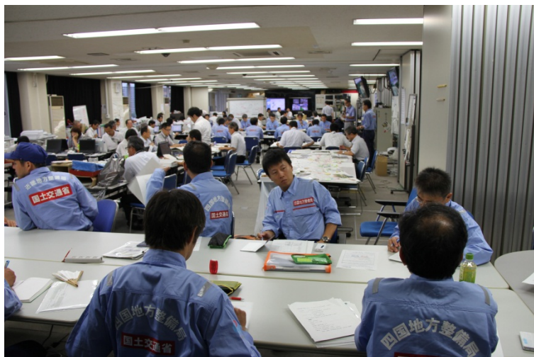
災害対策本部会議の様子 (中国地整)

◇支援概要：中国地整で概要説明。広島国道事務所にて九州地整より土砂撤去支援の作業内容について引き継ぎ