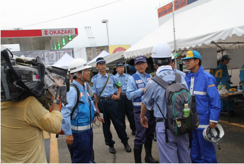
溪流安全点検前の現地対策本部協議

◇調査概要：救助活動再開のための溪流安全点検（国総研、四国地整 随員：警察、消防）