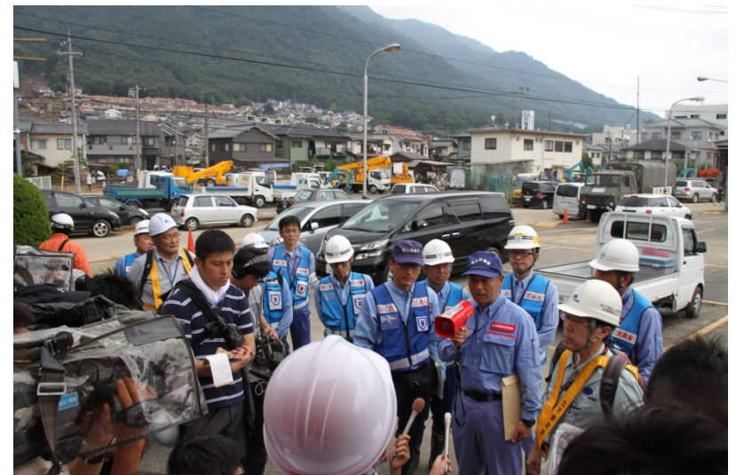
国総研による記者会見