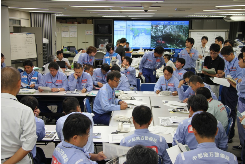
国総研、土研へ渓流点検結果報告