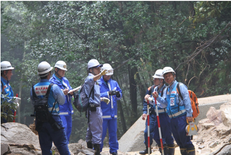
警察、消防への安全確認のポイント説明