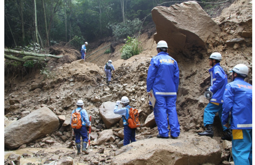
救助活動再開前の溪流安全点検