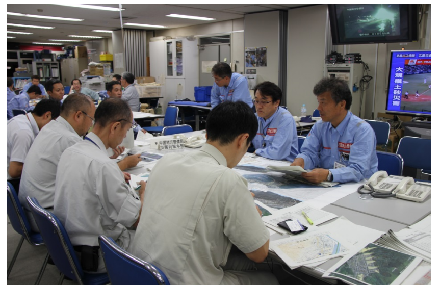
広島県等への渓流点検結果説明