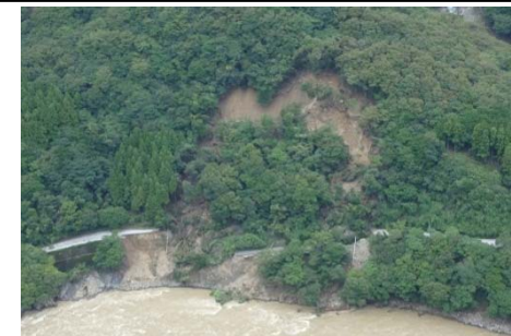
●高知県北川村平鍋 国道493号斜面崩壊状況