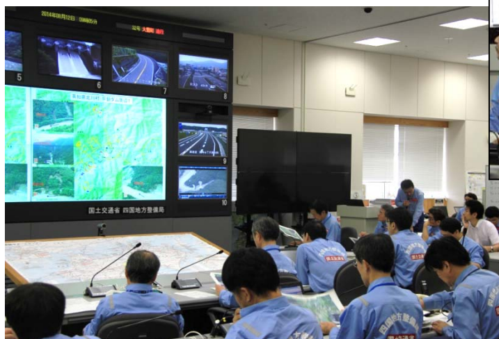
●調査翌日(8月12日)本部会議で調査結果の報告を受ける四国地整