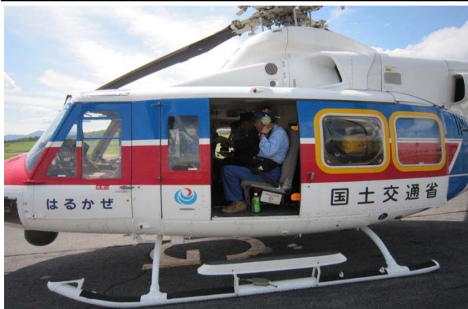
●「はるかぜ号」被災調査へ発進