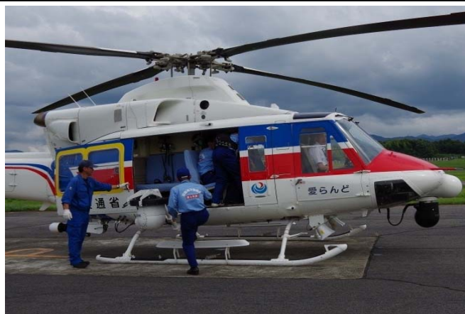
●「愛らんど号」被災調査へ発進