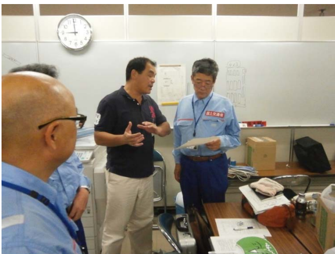
●被害情報などの情報収集