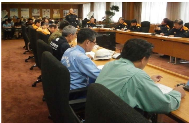
●災害対策本部会議へ出席(徳島県)