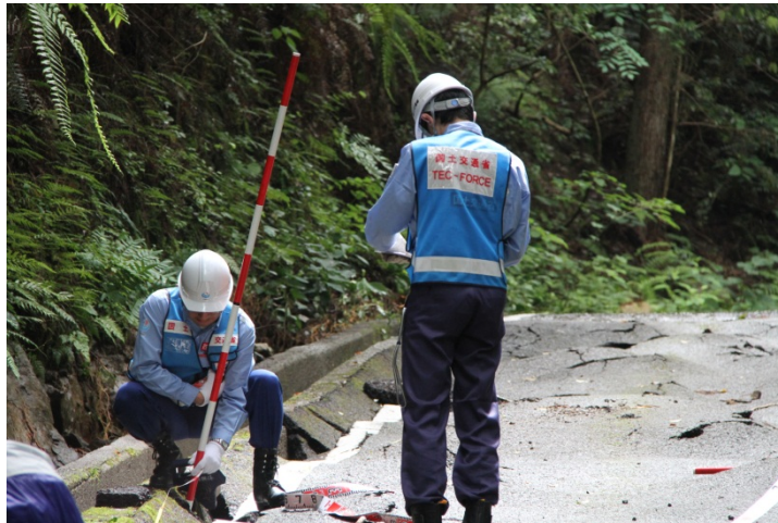
町道矢野川線 被災箇所の簡易測量

◇調査概要：現地調査、簡易測量結果より被災状況・復旧方法の提案などを整理し、調査報告書を黒潮町へ提出