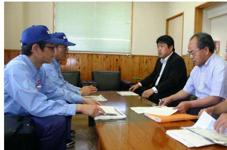
被災状況等 調査結果の報告