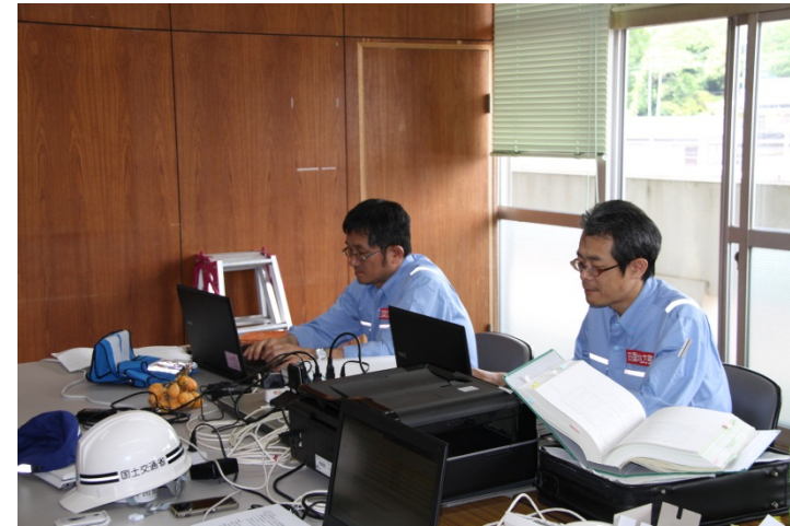
被災状況等の整理作業(内業)