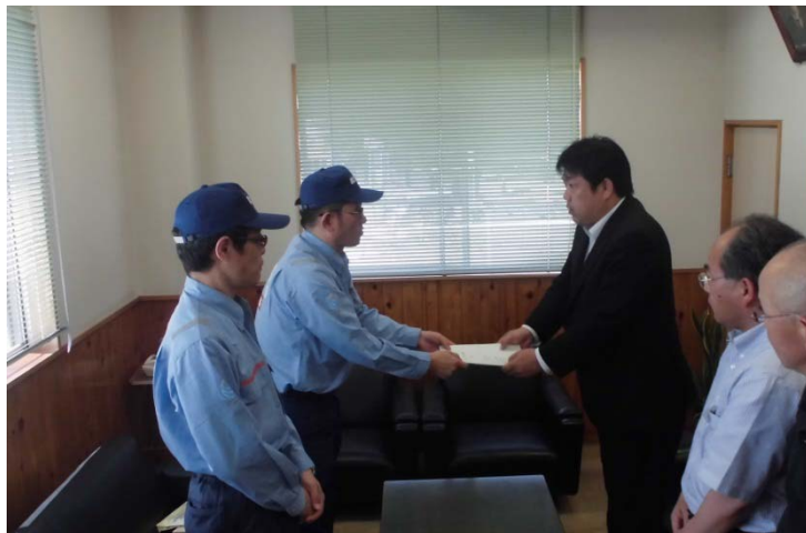
黒潮町長に調査報告書を提出