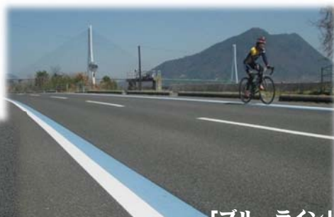
「ブルーライン」 距離や目的地なども表示