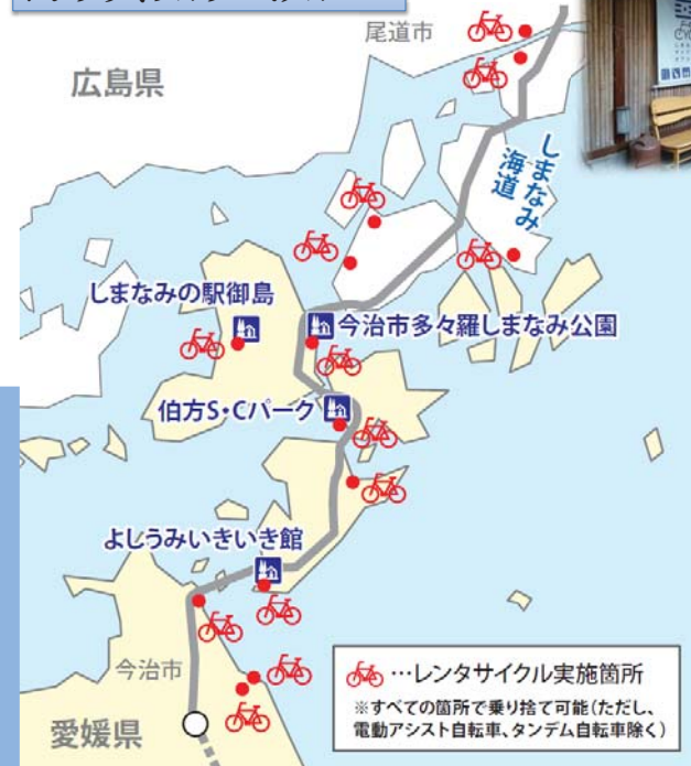
しまなみ海道沿線 レンタサイクルターミナル