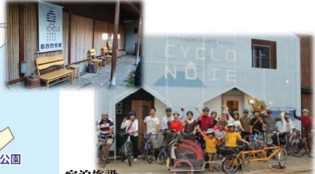
宿泊施設 “シクロツーリズムしまなみ”