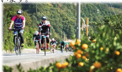
国際大会「サイクリングしまなみ」(2016.10) 国内外から約3,500サイクリストが参加