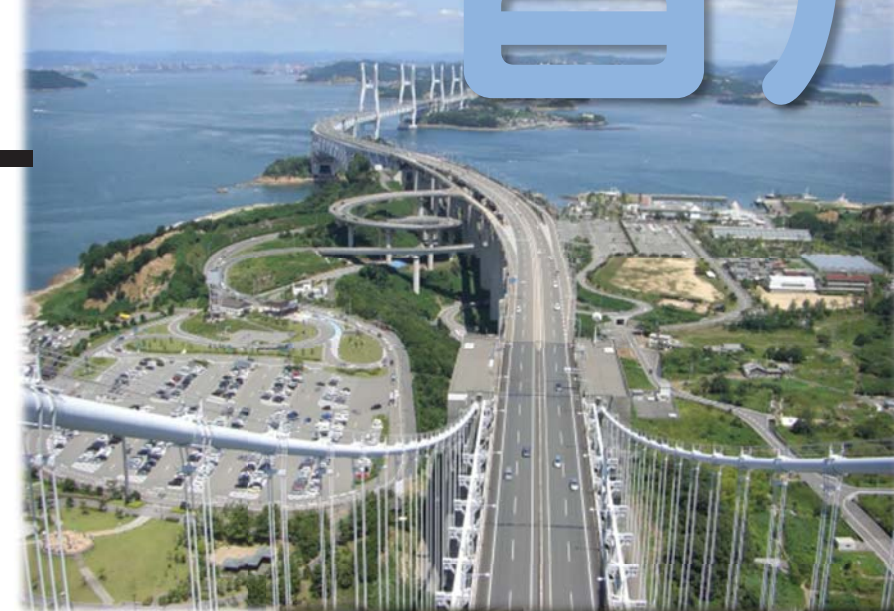
JR瀬戸大橋線が真横を駆け抜ける管理路