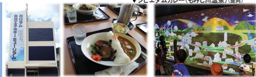
お絵かきスマートタウン(川口ダム ミュージアム内) ▲ 紙に自由に絵を描くと、描いた絵が立体で巨大な絵の街に出現し、動き出します。