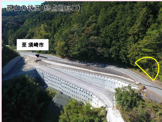
現在の状況【終点側坑口】