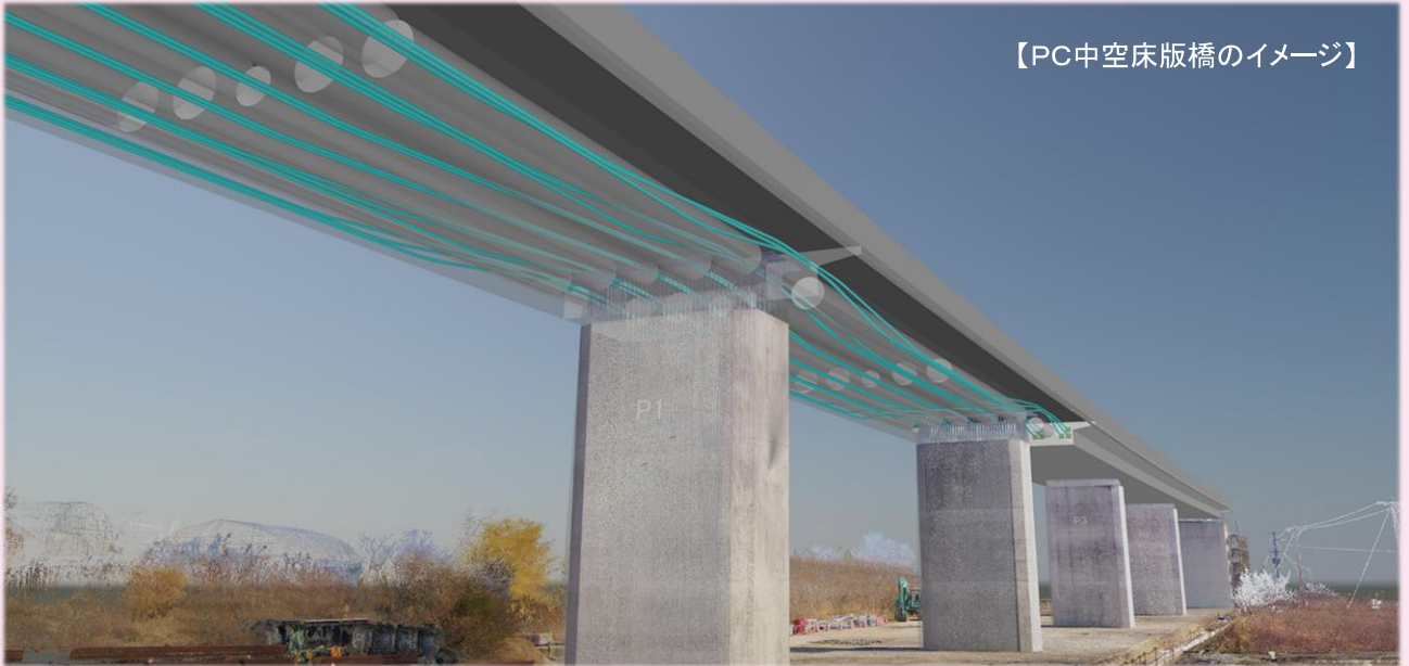
【PC中空床版橋のイメージ】

高知東部自動車道 芸西ICから安芸西IC（仮称）間の工事となります。 本工事では、PC橋（プレストレスト・コンクリート橋）上部工事の施工現場を間近で見学することができます。