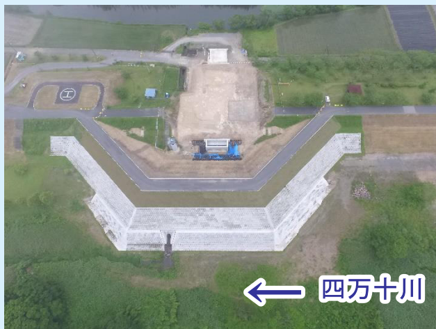
【施工中 令和5年5月現在】

旧施設より大きい排水能力を有する樋門を新設する事により、大雨による洪水を安全に流下させ家屋等への浸水被害の解消を図るものです。