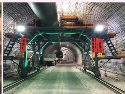
【トンネル内の状況】