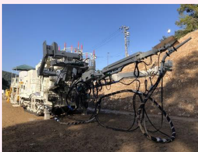
【コンクリートを吹付ける機械】