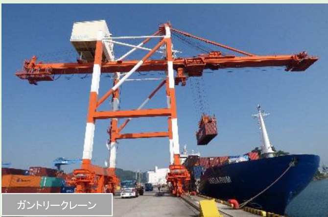
ガントリークレーン