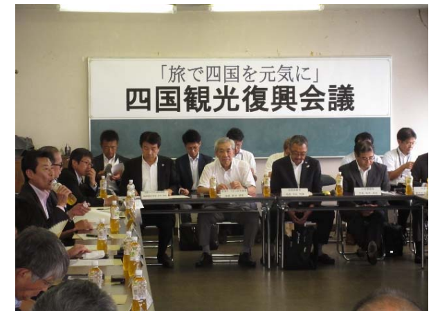
<8/21四国観光復興会議>