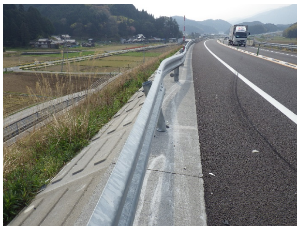
写真1 E氏の事故により破損したガードレール

上記の外、2名についても、上記と同様に臨戸督促や役場などで所在の確認を行ったが、滞納者本人に会うことはできなかった。