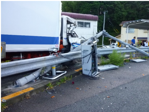
写真2 G社による事故現場

告知をしたが、令和元年の国税滞納処分による差押え後、未納状態を経て会社が解散した。令和4年度に臨戸督促をしたが会社は既になく、会社の清算人のとも連絡がとれない状況である。