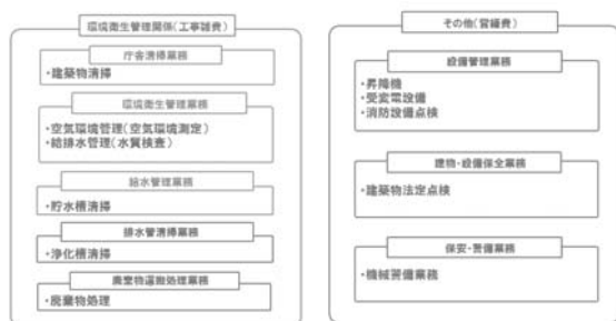
図-2 業務選定イメージ

庁舎管理業務を受注する事業者は、厚生労働省令に基づく建築物における衛生的環境の確保に関する事業の登録を行っていることが前提となりますが、平成31年4月末時点、香川県において、清掃・環境衛生管理・給水管理の3事業を登録している事業者はいるものの、4事業以上の業務を単独受注で履行できる事業者はいない状況です。