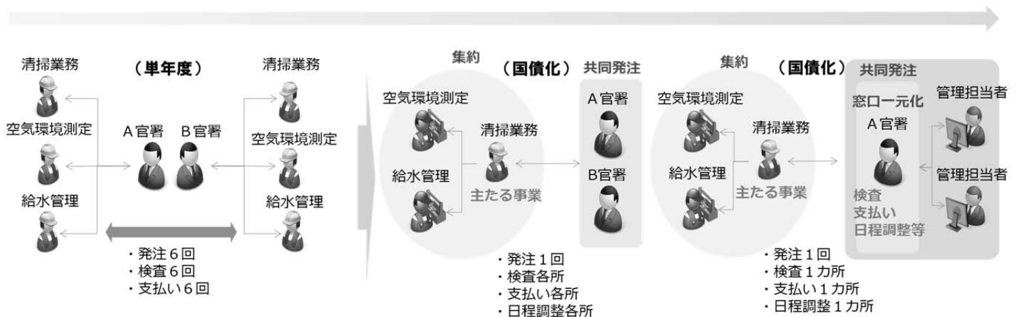
図-1 窓口一元化のイメージ

最終目標は、発注担当者個人の負担軽減だけでなく、発注者である国と受注者である事業者双方にとって業務改善となるような事務手続きの効率化・簡素化です。そして、業務改善の効果として、新たなニーズ等へ対応するための業務時間と生活を豊かにするプライベート時間を創出し、ワークライフバランスの推進を目指します。