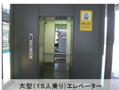
大型(15人乗り)エレベーター