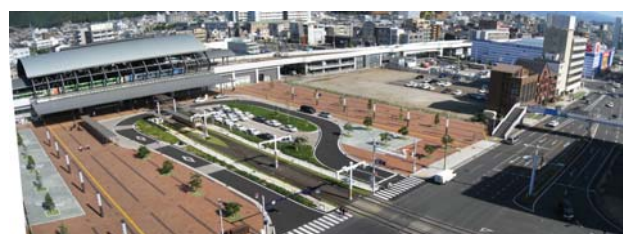
整備後の高知駅周辺全景

高知駅周辺地区においては、高知県・高知市・四国旅客鉄道（株）が一体となって都市整備に取り組み、平成21年5月に南口駅前広場を含め全面供用開始されました。