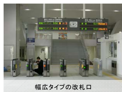
幅広タイプの改札口