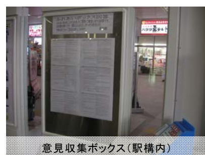
意見収集ボックス(駅構内)