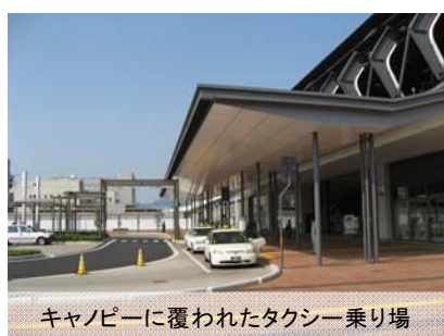
キャノピーに覆われたタクシー乗り場