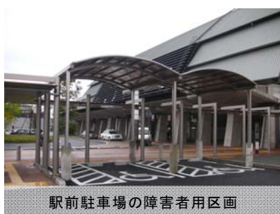
駅前駐車場の障害者用区画