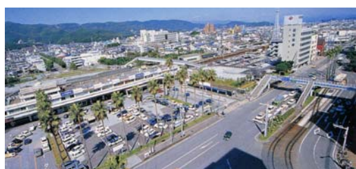
従前の高知駅周辺全景