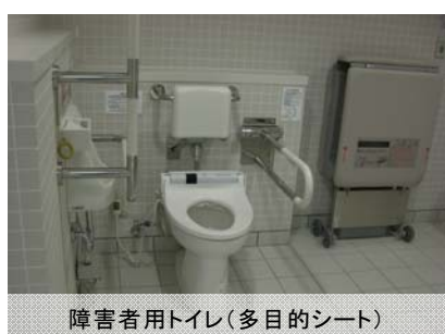
障害者用トイレ(多目的シート)