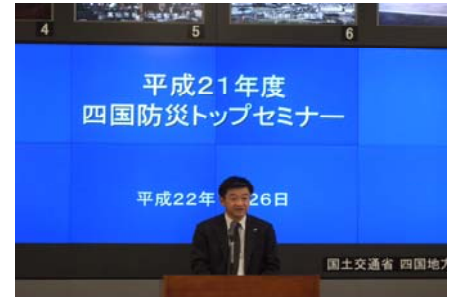
【主催者挨拶 足立四国地方整備局長】