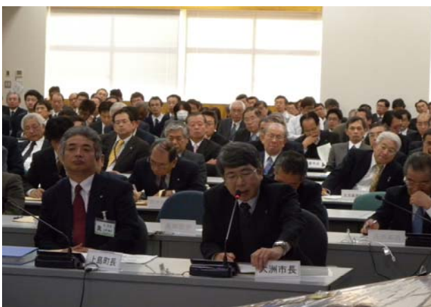
【意見交換会 大洲市 清水市長】