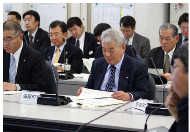
【意見交換会 海陽町 五軒家町長】

本施策は、四国広域地方計画「No.6防災向上プロジェクト」の取り組みに該当します。