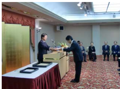
授与式の様子(明治記念館において)