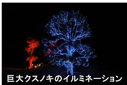
巨大クスノキのイルミネーション