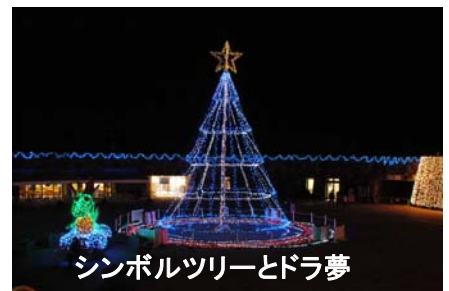
シンボルツリーとドラ夢