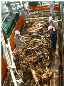
いしづち(基地港:松山港) 流木回収状況