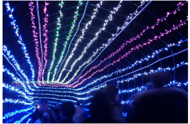
今回初登場予定の光のトンネル（長さ約50m）

期間中は、園内を約35万球の色とりどりのイルミネーションやライトアップで装飾し、幻想的な雰囲気 연출します。エントランス広場にそびえる高さ約10mのシンボルツリーや昇竜の滝の上に姿を見せるシャンパンガラスタワーをはじめ、毎年恒例となったドラ夢くんのトピアリーや巨大クスノキのイルミネーション、昇竜の滝のライトアップのほか、今回新たなイルミネーションとして、風花の庭に壮大に広がるグランドイルミネーションと長さ約50mの光のトンネルが登場する予定です。