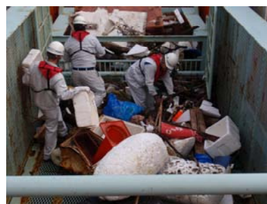
みずき(基地港:小松島港) ゴミ回収状況