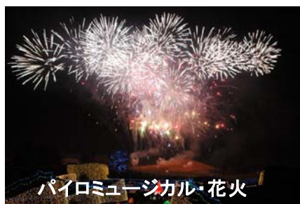
パイロミュージカル・花火