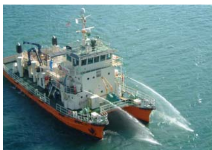
わしゅう(基地港:坂出港) 油回収状況