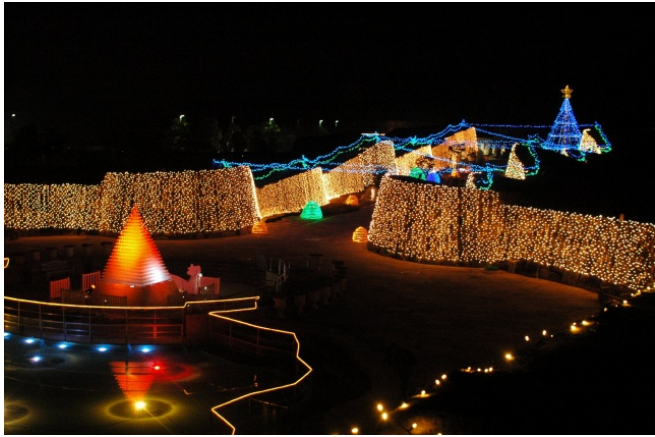
昨年度の幻想的な緑と石のヴィスタの様子

国営讃岐まんのう公園では、11月28日（土）から翌年1月3日（日）までの期間「ウィンターファンタジー」を開催中です。