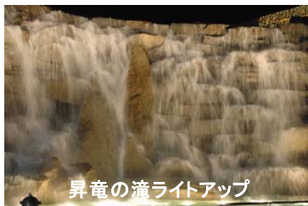
昇竜の滝ライトアップ

皆様、ぜひ国営讃岐まんのう公園の「ウィンターファンタジー」へ足をお運びください。