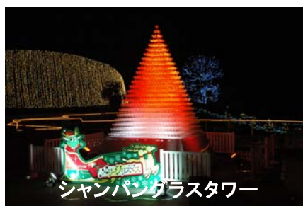
シャンパンガラスタワー