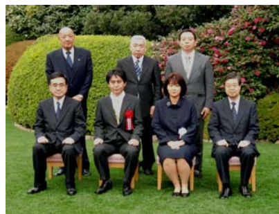
人事院総裁・港湾局長との記念撮影