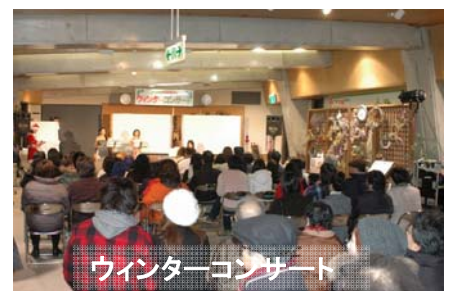
ウィンターコンサート

イベントなどの詳細につきましては、国営讃岐まんのう公園 HP ( http://www.mannoukouen.go.jp/ ) 又は、まんのう公園管理センター（TEL. 0877-79-1700）までお問い合わせください。