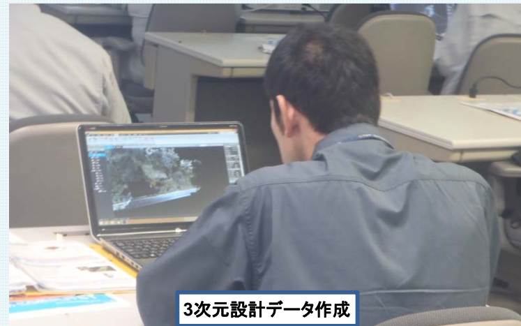
3次元設計データ作成