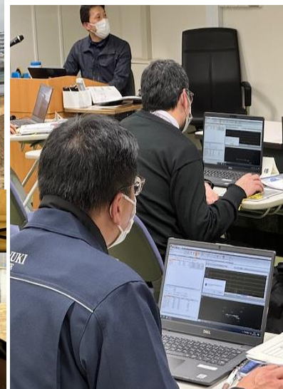
3次元設計データの作成