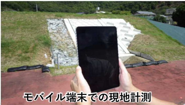
モバイル端末での現地計測