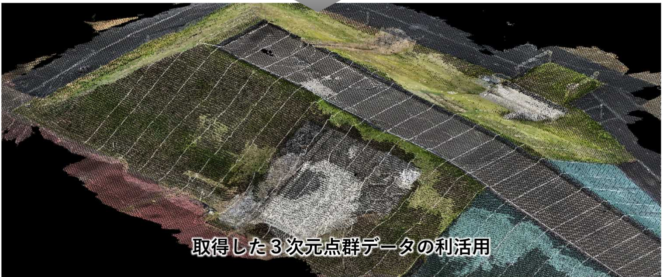
取得した3次元点群データの利活用