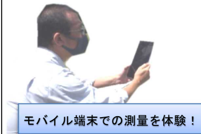
モバイル端末での測量を体験！