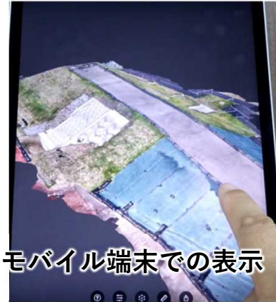
モバイル端末での表示