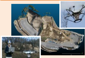
現況地形の 3次元点群データ化