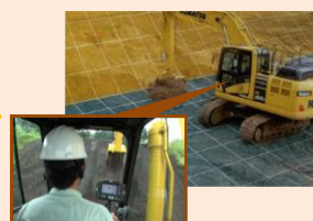
3次元設計データに 基づき建設機械を制御