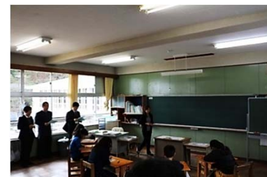
児童自身が思うことをワークシートに記入