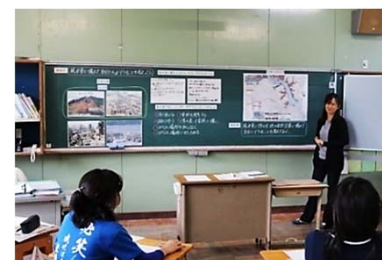
板書計画を基にした授業を展開