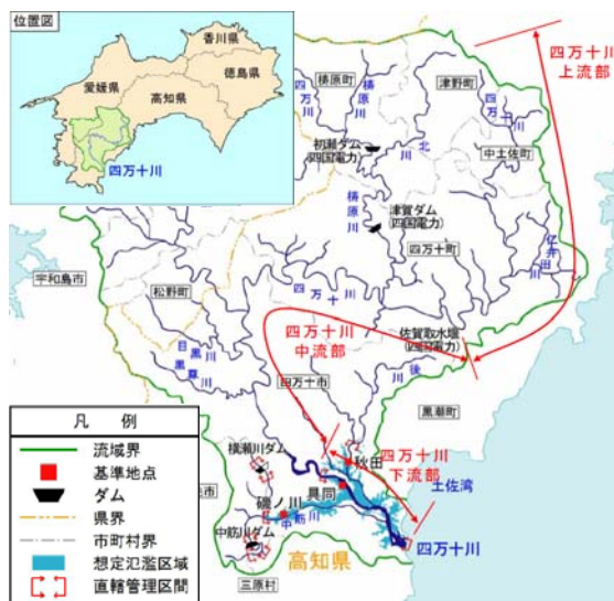
四万十川流域図と八束小学校の位置