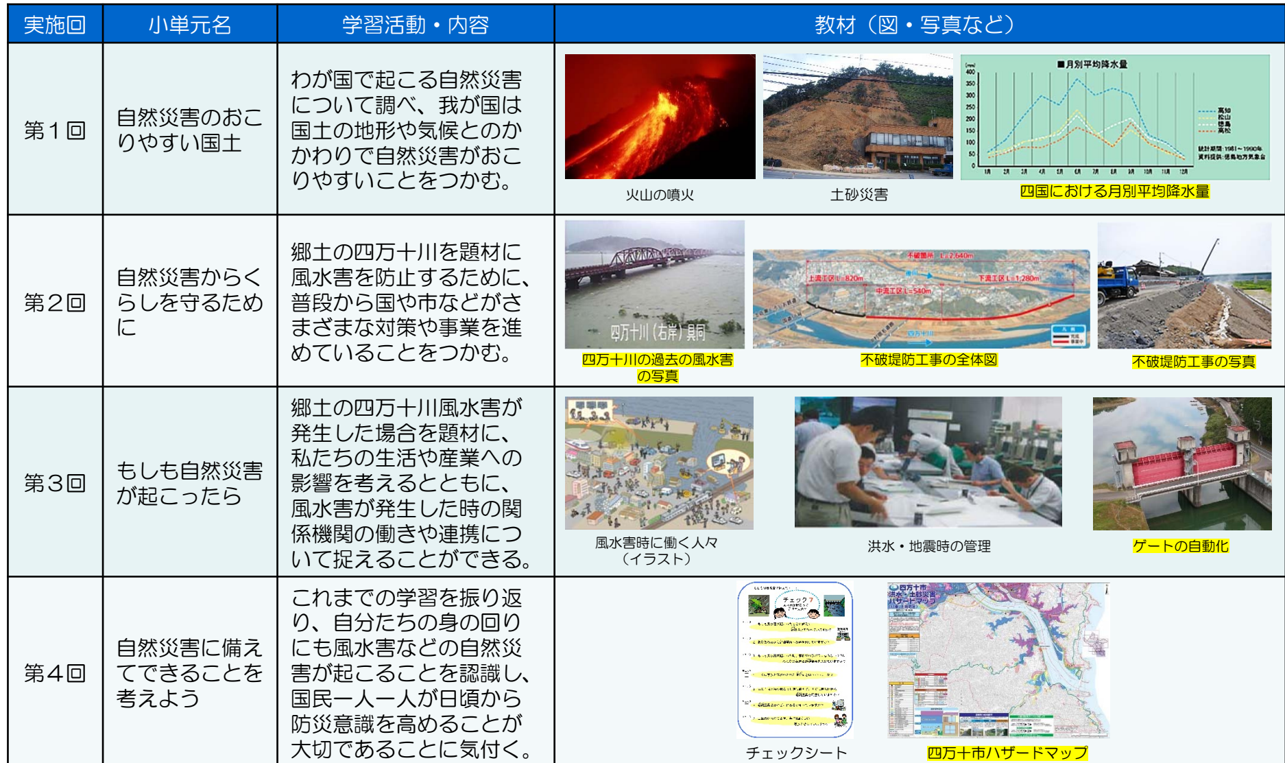
表 試行授業の構成及び内容 ※授業対象地域周辺に関する教材は黄色の網掛けで表示

各機関が保有している気象データや写真、治水対策などに関する資料を活用し、教材作成を行いました。教材作成にあたっては、災害から自分の身を守ることができるよう、自然災害に関する知識や防災対策等への理解を意識し、作成しました。