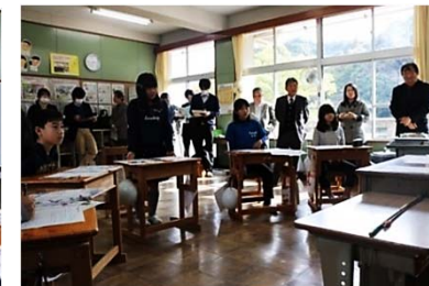
教師からの問いかけに対し、答える児童