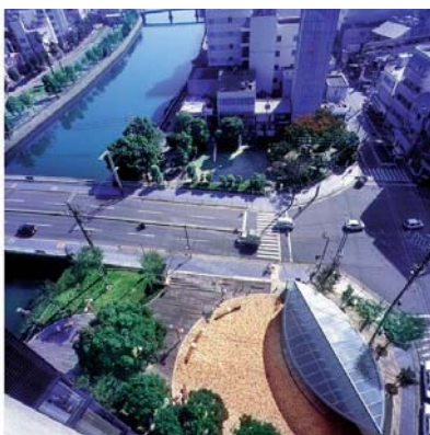
▲ 両国橋西詰 公園部分。直径24mの縁に囲まれた円周上に都市公園トイレを設置。