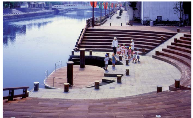
▲ しんまち公園。写真中央部の浮き桟橋は満潮時にはステージとしても利用が可能。