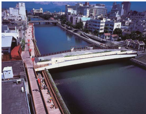
▲ しんまちボードウォーク通路。既存のふれあい橋から左右にアプローチ可能な車路を設置。橋下はアンダーパスにて通り抜け可能。