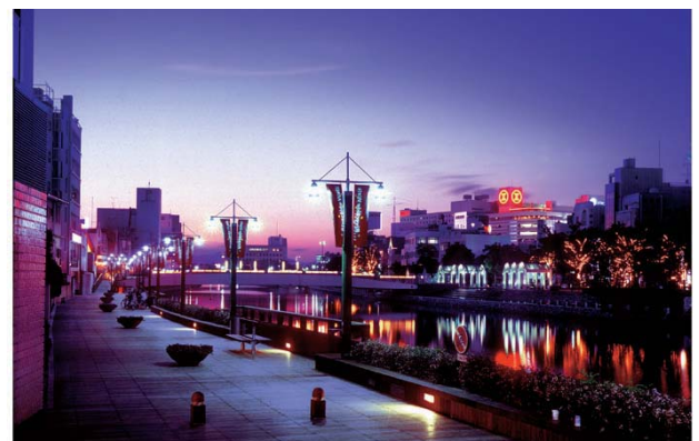
▲ しんまちボードウォーク夜景。