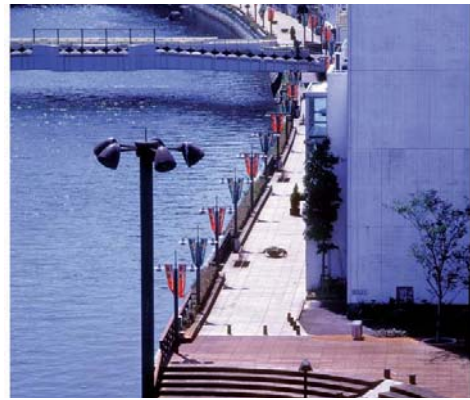
▲ しんまちボードウォーク通路。床、縁石、手摺り、ベンチ、照明等、主要部分がイペ材で作られている。