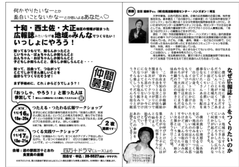
上) 広報誌づくり呼びかけチラシ 下) 広報誌づくりの様子

地域のキーパーソンとなるような方々と出会い、コミュニケーションをとりながら、イベントでの展示・メルマガの発行・地域外での産物販売など行っているところである。中でも、地域の若者を中心に取り組み始めた「きき合う、しり合う、みんなで作る広報誌」づくりの今後期待できる。一方的に情報を発信するのではなく、地域の人々に聞きながら、地域の人ができるだけ関わってつくる広報誌をつくらうとしており、そのプロセスがすでに地域内に新しいコミュニケーションを生んでいる。