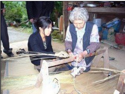
ほごろ作りの技術を記録

半ばあきらめていた集落維持のための機運が高まるとともに、ブログなどの情報を通じて、他出者や支援者の関心が徐々に集まるようになった。