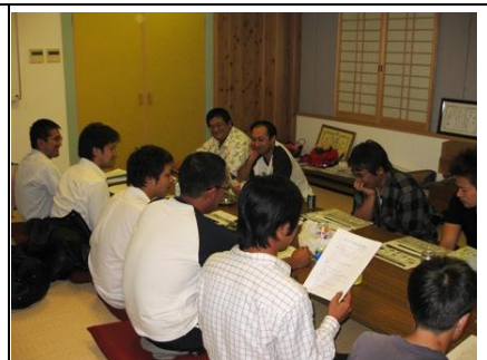
地元まちづくり団体等との懇談