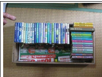
他出者調査で確認41年間分の日記

4人の都市からの若者についてマスコミ取材などもあり、市全域に取り組みの様子が理解されるようになった。これまでの取り組みの様子や記録収集についての情報の問い合わせも来るようになり、モデル地域だけの事業から、少しずつ周辺地域住民の意識の向上につながってきつつある。