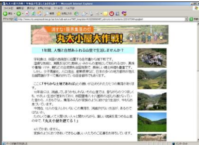
人材招聘の情報をHP掲載