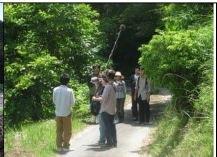
NHK松山による取材活動の様子