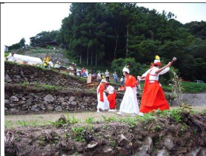
40年ぶりに盆踊りの復活