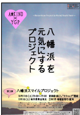
八幡浜元気プロジェクト（H20） 八幡浜元気プロジェクト

※要件を満たす団体の申請により審査、助成金を交付 平成22年度 6件、平成21年度 7件、平成20年度 5件、 平成19年度 5件、平成18年度 4件