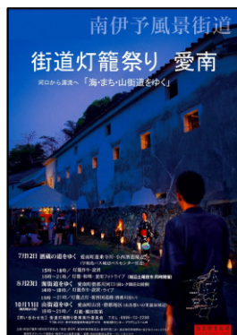
街路灯籠祭り 愛南実行委員会 街路灯籠祭り 海街道をゆく