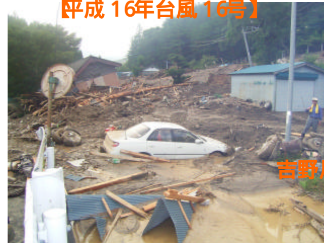
祖谷川流域の土砂災害 (三好郡東祖谷山村) 【平成 16年台風 16号】