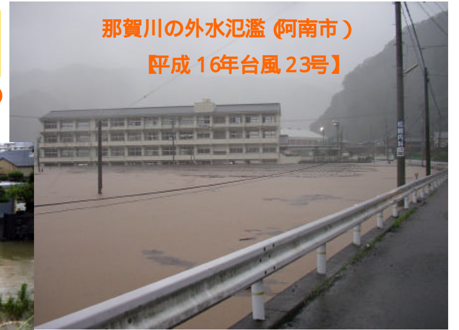
那賀川の外水氾濫 (阿南市) 【平成 16年台風 23号】