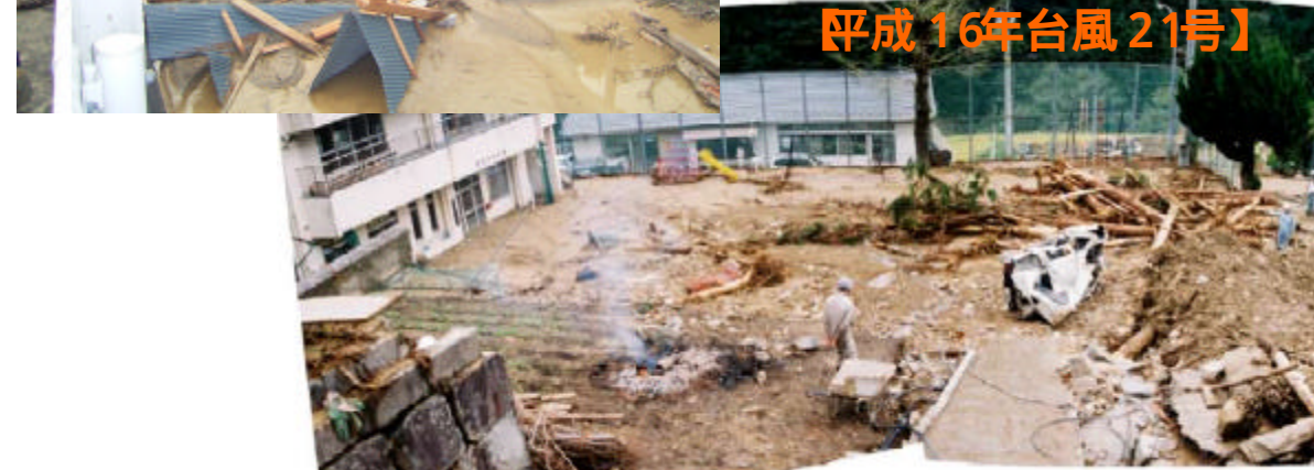
吉野川流域の土砂災害 (三好郡池田町) 【平成 16年台風 21号】