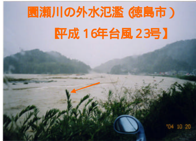
園瀬川の外水氾濫 (徳島市) 【平成 16年台風 23号】