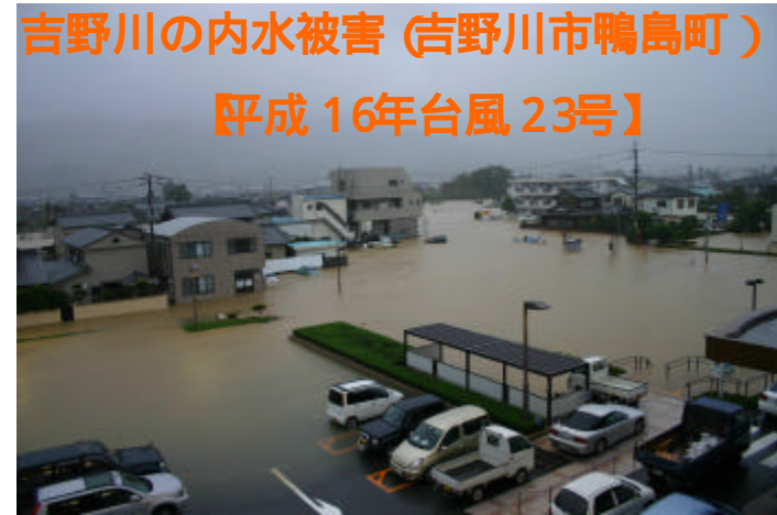
吉野川の内水被害 (吉野川市鴨島町) 【平成 16年台風 23号】