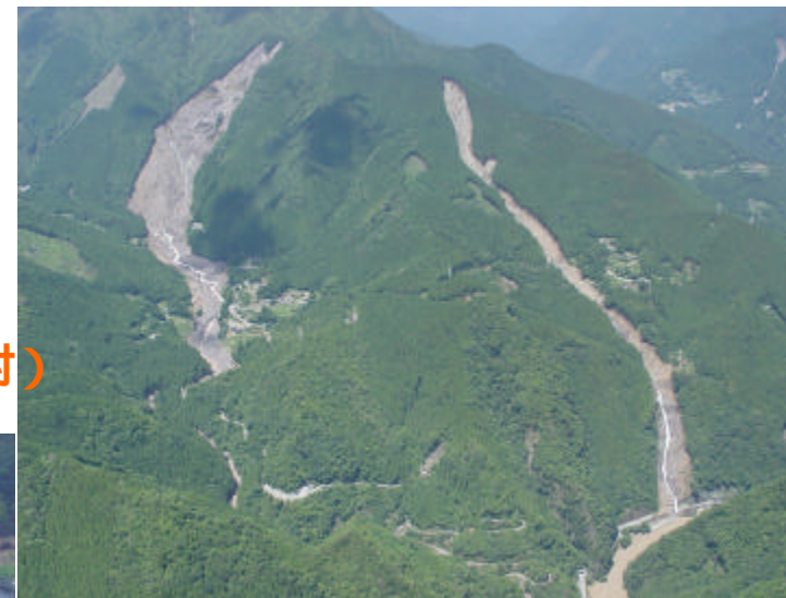
那賀川上流域の土砂災害 (那賀郡那賀町) 【平成 16年台風 10号】