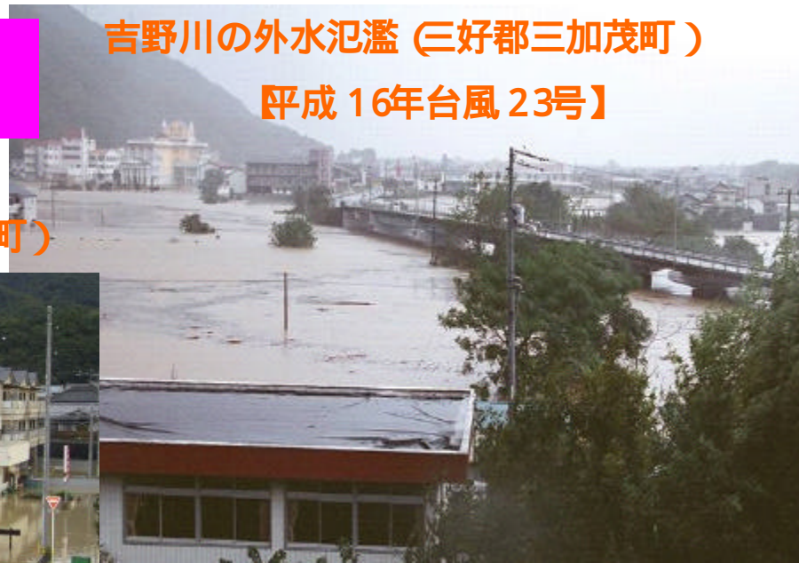
吉野川の外水氾濫 (三好郡三加茂町) 【平成 16年台風 23号】