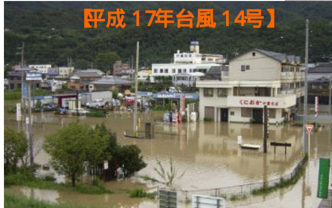
吉野川の内水被害 (美馬市脇町) 【平成 17年台風 14号】