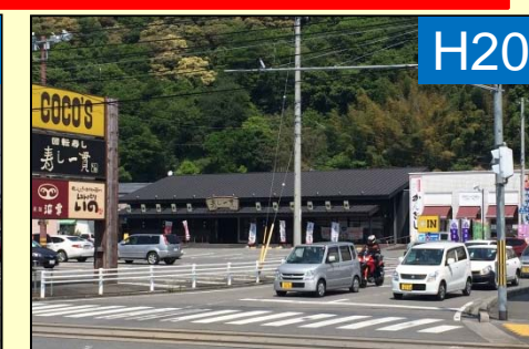
大型商業施設が新規オープン (H19.2.25) 大型商業施設前に電停完成 (H19.1.10)