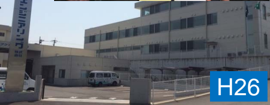
災害時に頼りになる電気設備会社の進出 発電施設・通信網の早期復旧が可能 (H26.7移転)