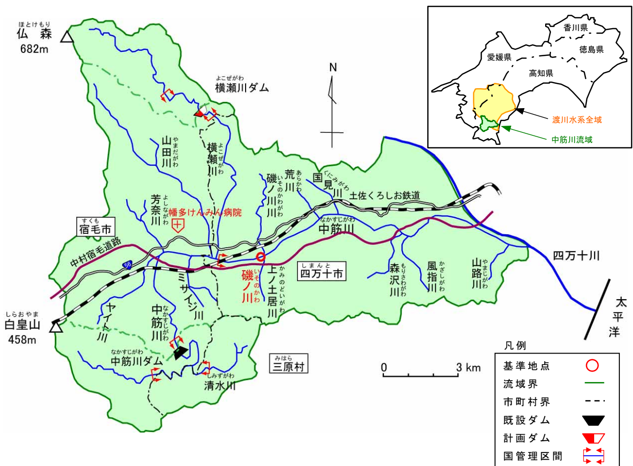
図 1-2-1 渡川水系中筋川流域図