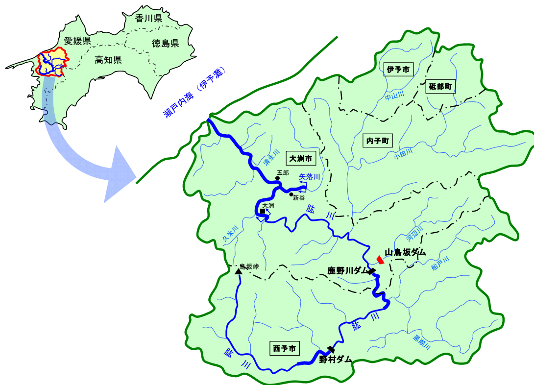
図 1.2.1 肱川水系流域図