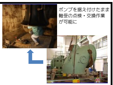
ポンプを据え付けたまま軸受の点検・交換作業が可能に

従来、河川排水用の大型立軸ポンプの水中軸受の点検・整備は構造上、ポンプ本体を引き上げて分解する必要があったが、軸受の位置を工夫することで、ポンプを据付けた状態のままでも水中軸受の点検・整備を可能とした。 本開発技術(特許取得技術)により、点検・整備にかかる作業コストを大幅に削減でき、また、点検・整備による設備停止期間の短縮もはかれるようになった。