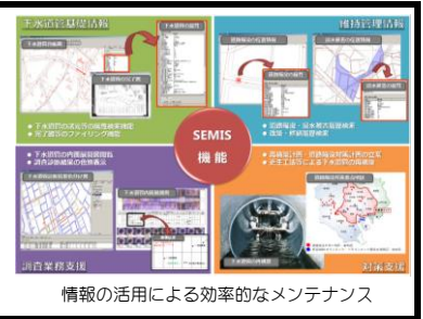
情報の活用による効率的なメンテナンス

東京都区部の下水道は国内最大の規模を誇り、下水道管網の総延長は16,000kmにも達している。 この膨大な下水道管のメンテナンスを効率的かつ効果的に実施するために、「下水道管のビッグデータ」を補修や再構築などの計画立案・工事発注に活用している。 ※「下水道管のビッグデータ」：下水道管基礎情報、維持管理情報、管路内調査診断情報、補修・再構築等の工事情報等に関する膨大な情報