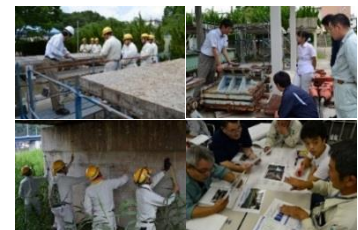
e+iMec講習会【橋梁点検(基礎編)】実施状況

舞鶴工業高等専門学校では、地域のインフラの維持管理・修繕等に対応できる建設技術者を地域で育成する常設の教育機関として社会基盤メンテナンス教育センター（略称 i Mec）を開設し、行政機関や民間企業等の建設技術者を幅広く受け入れている。アクティブ・ラーニングを基軸とした橋梁メンテナンス技術者育成教育プログラムによる講習会の開催やeラーニングによる実務者の学修環境の整備、行政機関や民間企業等と連携した推進体制構築等、地域のインフラメンテナンスを支える中核的施設として活動している。