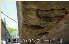
桁端部のコンクリート剥離