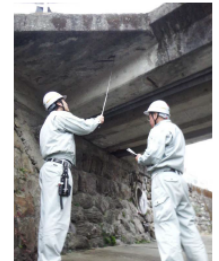
自治体職員による点検状況 【点検箇所：町道菊菜線 菊菜橋】