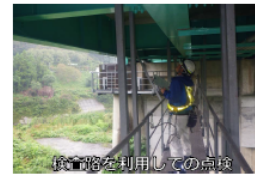
梯子を利用しての点検