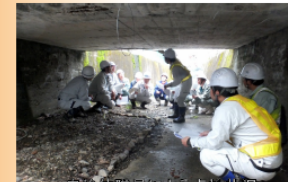
自治体職員による点検状況 【点検箇所：市道 地蔵原明神木線 地蔵原北橋】