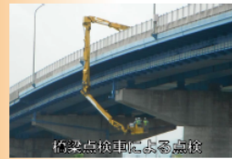
橋梁点検車による点検

橋梁は様々な部位・部材で構成されており、普段通る橋面上からは見えないところにも、橋を支える重要な部位・部材があります。5年に1度の近接目視による点検では、橋の下面まで入り、触診や打音検査を行い、損傷度合いについて診断を行います。