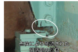
点検により確認された桁端部の腐食