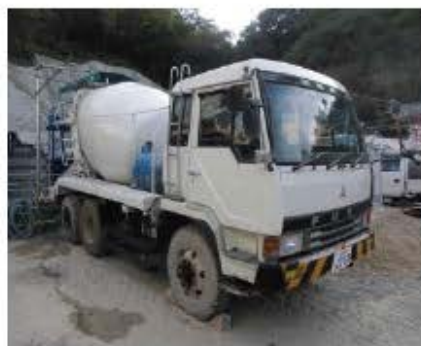
コンクリートミキサ車

掘削後のトンネルが崩れるのを防ぐために、吹付けプラントで製造したコンクリートを吹付け機に運びます。