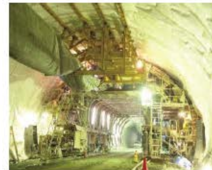
全断面スライドセトル

トンネルをコンクリートで仕上げるための鋼製の大きな型枠です。一回の施工で約10mの覆工コンクリートを打設することができます。