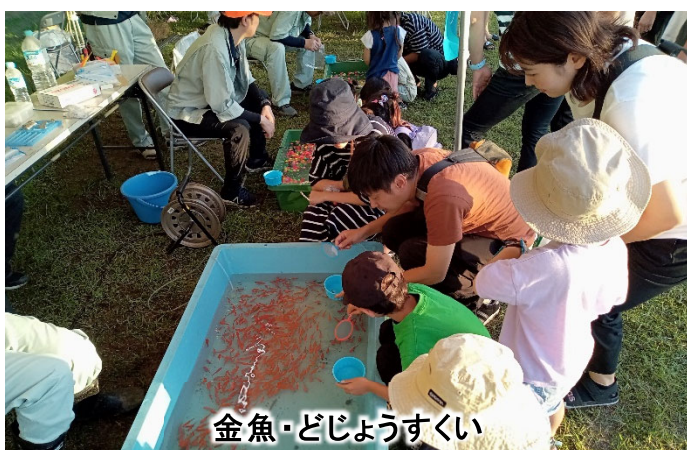
金魚・どじょうすくい