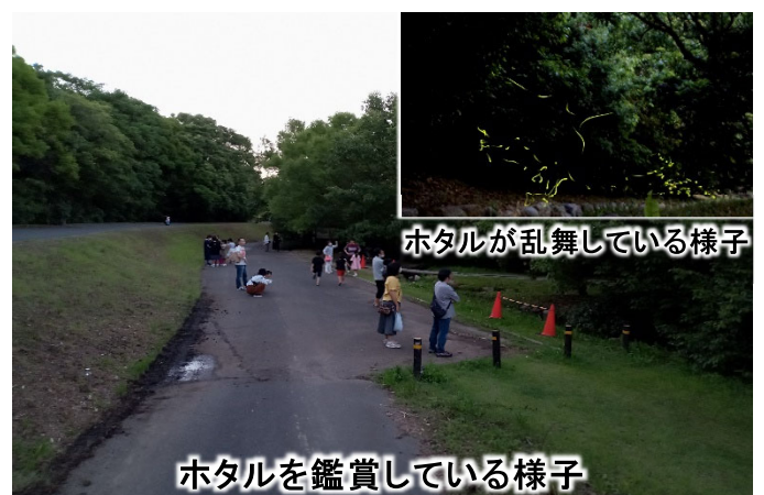
ホタルを鑑賞している様子