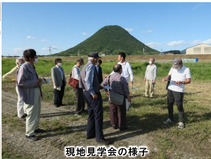
現地見学会の様子

土器川リバーキーパーズ通信は、皆様のご意見・ご質問に河川管理者としてお答えしていくものです。土器川に関して、気になっていること、わからないことなど、どしどしとご意見をお寄せください。